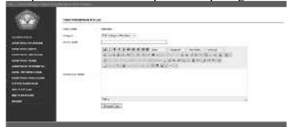
Gambar 9 Halaman Input Kamus Istilah Akuntansi

Halaman input kamus istilah akuntansi digunakan untuk memasukan apa saja istilah-istilah akuntansi yang ada, deskripsi istilah tersebut serta kategori istilah akuntansi yang ada. Tampilan dari halaman input istilah akuntansi dapat dilihat pada gambar 9.