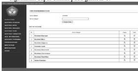
Gambar 8 Halaman input kategori kamus istilah akuntansi

Halaman input kategori kamus istilah digunakan untuk memasukan kategori apa saja yang akan digunakan dapat dilihat pada gambar 8.