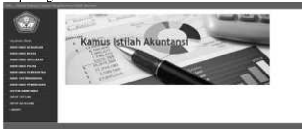
Gambar 7 Halaman Utama Administrator

Halaman utama administrator berfungsi untuk memasukan data istilah akuntansi dan input kategori yang ada. Dibawah ini merupakan tampilan halaman utama administrator pada kamus istilah akuntansi. Tampilan halaman utama administrator dapat dilihat pada gambar 7 di bawah ini.