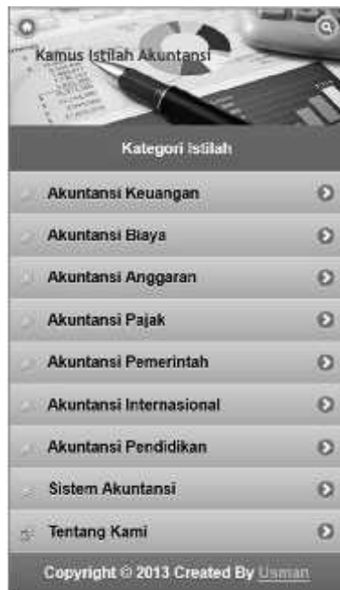
Gambar 6 Tampilan Menu Utama