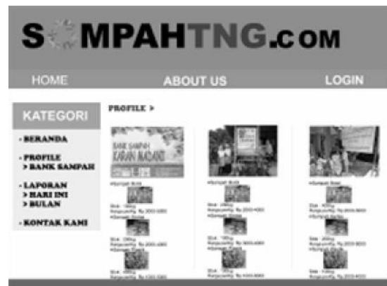
Gambar 7. Tampilan Profil Bank Sampah

Pada tampilan profil bank sampah, pengguna dapat mengetahui dimana letak kantor bank sampah yang bersangkutan dan melihat stok barang yang tersedia di bank sampah tersebut secara rinci beserta gambar dan harga yang ditawarkan.