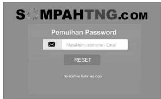
Gambar 6. Tampilan Form Lupa Password

Jika terjadi kesulitan dalam mengakses akun, pengguna dapat melakukan reset password pada form lupa password.