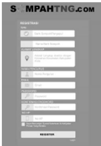
Gambar 4. Tampilan Form Registrasi

Pada form registrasi berisikan kolom-kolom data diri. Data yang dimasukkan harus valid agar dapat di verifikasi sebagai member.