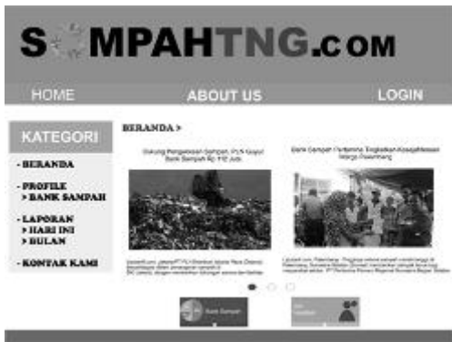
Gambar 3. Tampilan Menu Home