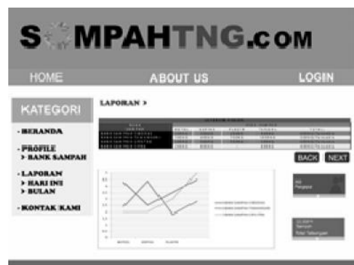
Gambar 7. Tampilan Laporan Bank Sampah

Pada tampilan laporan bank sampah, pengguna dapat mengetahui stok yang tersisa, berapa banyak yang terjual, grafik yang menunjukkan peningkatan ataupun penurunan penjualan tiap bank sampah.