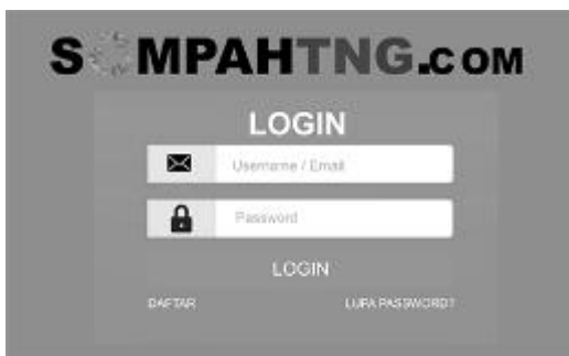
Gambar 5. Tampilan Form Login

Pada form login pengguna menginputkan username dan password yang telah terdaftar agar bisa menggunakan fitur SAMPAHTNG.COM.