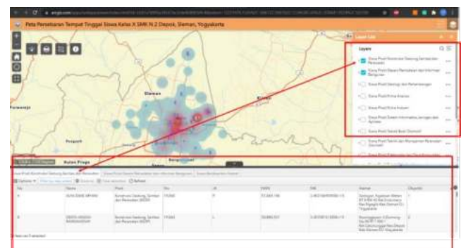
Gambar 5. Tampilan Fitur Layer dan Atribut Pada WebGIS