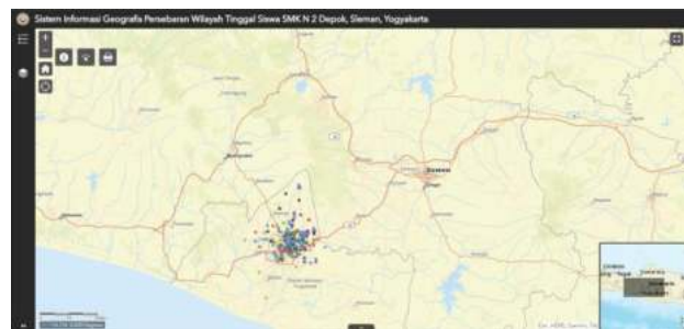
Gambar 1. Tampilan WebGIS SMK N 2 Depok

Berdasarkan data induk siswa SMK N 2 Depok tahun ajaran 2021/2022, jumlah siswa baru atau kelas IX semua jurusan sejumlah 650 siswa. Sedangkan data siswa kelas X dan XI tidak terekam dalam penyimpanan memori data karena kerusakan harddisk sebagai media penyimpanan data digital yang dimiliki oleh sekolah. Sekolah tidak memiliki penyimpanan data digital cadangan. Dengan asumsi jumlah rata-rata, maka terdapat 1.300 data digital siswa yang hilang. Hal tersebut menjadi salah satu contoh perlunya mengantisipasi simpanan digital, seperti penyimpanan pada cloud. Penyimpanan cadangan data pada cloud memiliki kelebihan yaitu keamanan data dapat dijaga, dalam artinya data dapat diunduh setiap saat selama akun masih aktif. Oleh karena itu data yang digunakan sebagai input pembuatan WebGIS adalah hanya data siswa kelas IX. Selain memperoleh visualisasi data persebaran spasial lokasi tempat tinggal, data tersebut dapat diunduh setiap waktu diperlukan karena sudah tersimpan dalam cloud. WebGIS SMK N 2 Depok dapat diakses pada laman berikut https://arcg.is/m0H9u . Tampilan awal ketika masuk ke dalam lama tersebut dapat dilihat pada Gambar 1. Sedangkan informasi legenda dan simbol yang terdapat pada WebGIS disajikan pada Gambar 2.