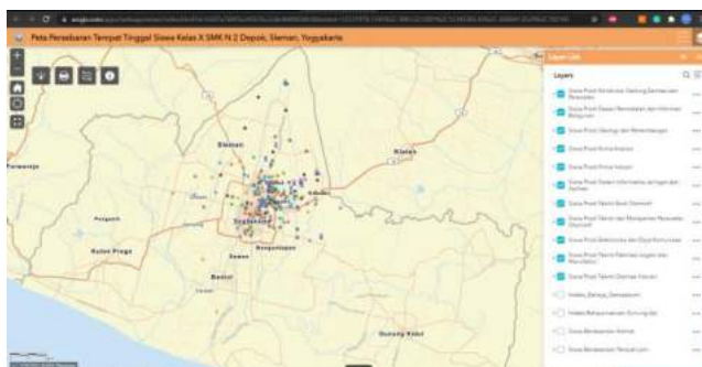
Gambar 3. Tampilan WebGIS Persebaran Lokasi Tempat Tinggal Siswa

Hasil pemetaan persebaran lokasi tempat tinggal siswa SMK N 2 Depok menunjukkan bahwa seluruh siswa berdomisili di Propinsi Yogyakarta, dengan dominasi di Kabupaten Sleman dan Kota Yogyakarta. Tampilan persebaran siswa disajikan pada Gambar 3.