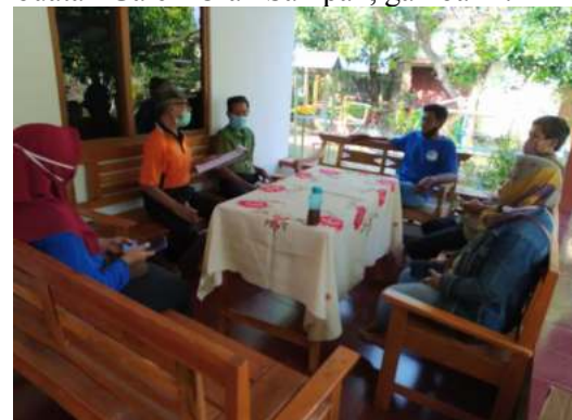
Gambar 1. Rapat dan Koordinasi

Berikut rapat dan koordinasi untuk merancang pembuatan Galeri Olah Sampah, gambar 1: