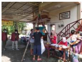
Gambar 10. Kegiatan Penimbangan Bank Sampah

Pendampingan kegiatan Bank Sampah dilakukan pada saat kegiatan penimbangan bank sampah di setiap bank sampah yang beroperasi. Berikut adalah salah satu kegiatan penimbangan bank sampah yang dilakukan oleh Bank Sampah Ben Resik RW 01: