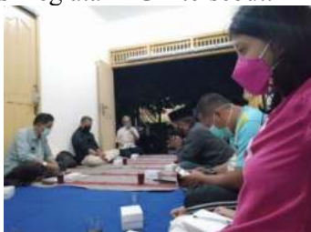
Gambar 15. FGD Koordinasi Incenerator/Flare

Dengan demikian masih harus ada tahap penyempurnaan lebih lanjut terhadap mesin tersebut. Dari hasil tangkapan asap yang telah dilakukan didapatkan kadar yang masih tinggi dan asap tersebut masih beracun dan berbahaya jika terhirup. Maka FGD segera dilakukan yaitu menyatakan bahwa mesin belum siap beroperasi sehingga hilir pengelolaan sampah masih terpusat pada TPS yang ada di jalan Bener. Berikut dokumentasi kegiatan FGD tersebut: