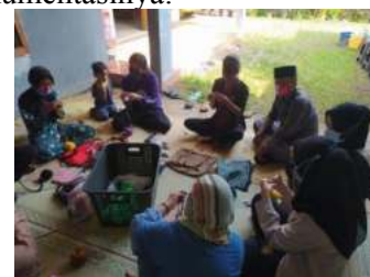
Gambar 13. Pelatihan Pembuatan Tas Rajut dari Kain Bekas

Kegiatan kedua yaitu pelatihan pembuatan tas rajut dari kain bekas. Disini memanfaatkan kain yang sudah terpakai agar tidak menjadi sampah. Berikut adalah dokumentasinya: