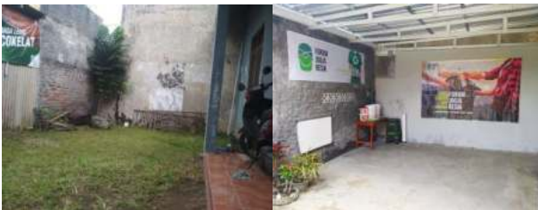
Gambar 4. Sebelum dan Sesudah Pembangunan Galeri Olah Sampah

Proses pembangunan Galeri Olah Sampah memerlukan proses selama 2 minggu, mulai dari dana turun dari pihak mitra, pembelian bahan bangunan, sampai proses pembangunan hingga selesai. Berikut adalah gambar sebelum dan sesudah galeri dibangun.