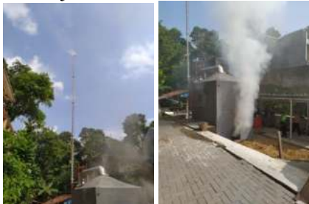
Gambar 14. Uji Coba Incenerator/Flare

FGD terkait operasionalisasi incenerator/flare dilakukan sebanyak satu kali kegiatan di rumah Bapak Haji Supardi pada tanggal 18 Juni 2021 jam 19.30 WIB. Hal ini membicarakan uji coba flare yang sudah dilaksanakan pada tanggal 12 Juni 2021 pukul 13.00 WIB. Pada saat uji coba yang telah dilakukan setelah tahap penyempurnaan mesin incenerator/flare yaitu dengan meninggikan cerobong asap maka didapatkan hasil bahwa mesin masih belum layak digunakan. Asap masih mengepul di bagian bawah melalui celah-celah pintu dan ruang pengambilan abu. Berikut adalah dokumentasi uji coba mesin tersebut: