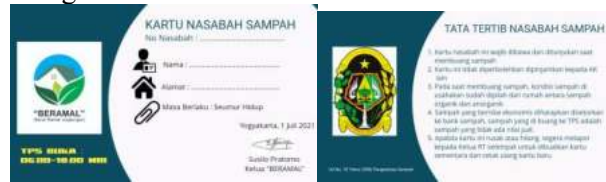
Gambar 16. Kartu Sampah

juga wajib memiliki kartu sampah yang berikan oleh Bank Sampah RW masing-masing, sehingga semua kepala keluarga wajib menjadi nasabah bank sampah. Berikut adalah kartu sampah yang dibagikan: