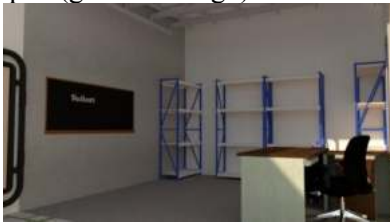
Gambar 3. Design Galeri Olah Sampah

Berikut adalah design rancangan pembuatan Galeri Olah Sampah (gambar design):