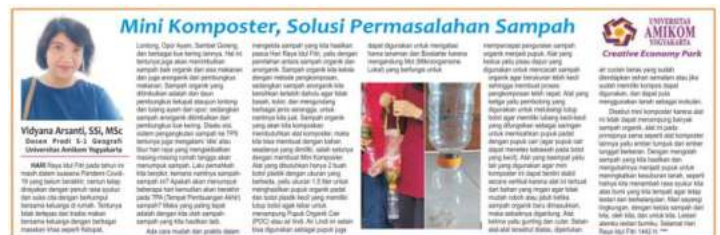
Gambar 8. Publikasi Kegiatan Pelatihan Pembuatan Pupuk Organik

Kegiatan ini dilakukan pada Hari Minggu, tanggal 2 Mei 2021 di Galeri Olah Sampah dengan pemateri ibu Vidiana Arsanti, S.Si., M.Sc. yang merupakan dosen program studi Geografi. Kegiatan diatas juga sudah dipublikasi kan melalui media cetak yaitu pada harian Kedaulatan Rakyat Hari Jumat Wage, 28 Mei 2021 hal.07 dengan judul "Mini Komposter, Solusi Permasalahan Sampah". Berikut adalah artikel yang berhasil didokumentasikan: