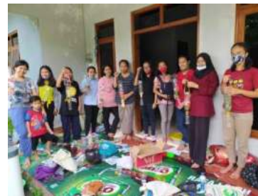
Gambar 7. Pelatihan Pembuatan Pupuk Organik dengan Mini Komposter

Selain dilakukan sosialisasi pembuatan pupuk organik juga diadakan pelatihan pembuatan pupuk organik dengan menggunakan berbagai alat komposter meliputi: keranjang takakura, ember tunggal, ember tumpuk, biopori jumbo, losida, dan mini komposter. Untuk kegiatan praktek yang dilakukan adalah dengan menggunakan mini komposter yang bahannya mudah dan memanfaatkan botol plastik yang sudah tidak digunakan lagi. Berikut adalah pelatihan pengkomposan dengan menggunakan mini komposter: