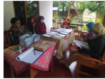
Gambar 11. Kegiatan Pengecekan Buku Administrasi Bank Sampah

Selain kegiatan pada saat penimbangan juga dilakukan pengecekan buku administrasi setiap bank sampah oleh Faskel dan DLH (Dinas Lingkungan Hidup) Kota Yogyakarta. Berikut adalah pengecekan buku administrasi bank sampah yang telah dilakukan: