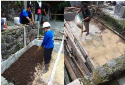
Gambar 9. Pembuatan Pupuk Organik Secara Komunal

Selain kegiatan sosialisasi dan pelatihan juga diadakan pembuatan pupuk organik dari sampah rumah tangga dan dicampur dengan pupuk kandang. Kegiatan ini dilakukan secara komunal untuk mengantisipasi masyarakat yang kesulitan dalam melakukan pengolahan sampah mandiri di masing-masing rumah tangga untuk sampah dapur, sehingga difasilitasi dengan memberikan pelayanan menerima sampah dapur pada masing-masing rumah tangga yang tidak mengolah sendiri. Namun dengan catatan bahwa masyarakat yang menyetorkan sampah dapur harus sudah dipilah terlebih dahulu dan tidak bercampur dengan sampah anorganik lainnya seperti plastik, kertas dan kaca atau logam. Penyetoran sampah dapur juga harus menggunakan Bagor atau ember plastik untuk membawa. Berikut adalah kegiatan pembuatan pupuk organik yang dilakukan secara komunal: