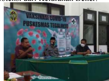
Gambar 2. Rapat dan Koordinasi

Dari hasil rapat kecil di bawa ke ranah Kelurahan, di sini menggandeng mitra dari luar Kelurahan Bener yaitu Forum Jogja Resik yang merupakan organisasi penggiat lingkungan yang tentunya melihat potensi dari Kelurahan Bener.