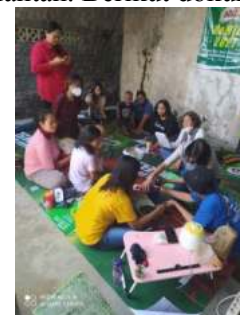
Gambar 12. Pelatihan Pembuatan Sabun MiJel

Pelatihan Ketrampilan Daur Ulang Sampah yang dilakukan adalah sebanyak dua kali kegiatan. Kegiatan pertama yaitu pelatihan pembuatan sabun dari minyak jelantah. Berikut dokumentasinya: