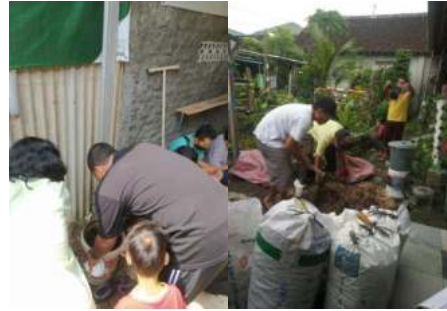
Gambar 6. Sosialisasi Pembuatan Pupuk Organik

Pengkomposan dilakukan secara komunal di lokasi bersebelahan dengan mesin Incenerator /flare, hal ini disebabkan hanya ada lahan yang cukup luas terpusat di lokasi tersebut bersebelahan dengan kandang ternak terpadu juga. Pengelolaan sampah organik komunal dilakukan oleh masyarakat dengan menggunakan biang organik yang berasal dari limbah sapi yaitu urin sapi dan lome. Berikut adalah proses pembuatan pupuk komunal yang dilaksanakan oleh masyarakat: