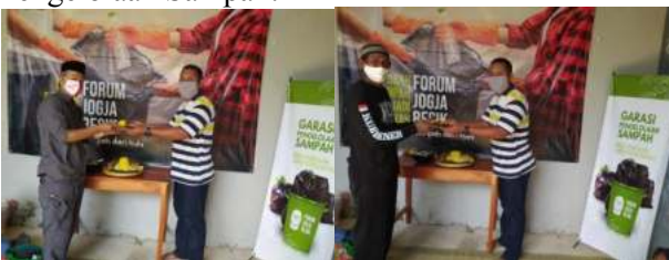
Gambar 5. Peresmian Garasi Pengelolaan Sampah

Setelah Galeri Olah Sampah selesai dibangun lalu diadakan peresmian Galeri Olah Sampah yang diberi nama Garasi Pengelolaan Sampah pada tanggal 26 Juni 2021, yang diresmikan oleh Lurah Bener, Ketua RW 02, dan Ketua Forum Jogja Resik (FJR). Berikut adalah gambar peresmian Garasi Pengelolaan Sampah: