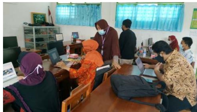
Gambar 2. Pelaksanaan Workshop Google Classroom

pembelajaran dan juga pengelolaan penugasan dan pembelajaran mandiri siswa. Kegiatan tersebut dapat dilihat dalam gambar 3 dibawah ini.