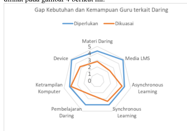
Gambar 3. Grafik Gap Kebutuhan dan Kemampuan Pembelajaran Daring

Gap Kemampuan Guru dalam Pembelajaran daring masih besar. Terlihat bahwa semua kemampuan guru masih dibawah dengan kemampuan pengelolaan Media LMS. Dan kemampuan Guru dalam keterampilan Komputer meningkat hingga batas kebutuhan. Begitu pula untuk pembelajaran tidak langsung (asynchronous Learning) sudah mendekati ideal kebutuhan. Menjadi tindaklanjut dapat dilakukan pendampingan Dalam mengelola LMS dan juga Pelatihan Intensif Tentang pembuatan materi yang lebih tertata dan Menyesuaikan kemampuan dan kebutuhan sekolah. Ilustrasi dapat dilihat pada gambar 4 berikut ini.