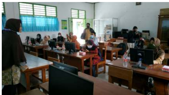
Gambar 2. Kegiatan Pelatihan Pembelajaran Daring

Kegiatan tersebut terlaksana seperti pada gambar 2 di bawah ini