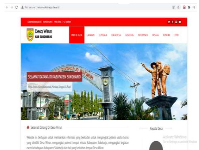
Gambar 1. Website resmi Desa Wirun

mempublikasikan desa wisata untuk mempromosikan kegiatannya melalui media internet masih cukup terbatas. Hal ini dipengaruhi karena keterbatasan sumber daya manusia yang dapat memanfaatkan teknologi informasi sebagai sarana promosi desa wisata. Berikut adalah potret dari halaman muka website Pemerintah Desa Wirun, yang dapat diakses melalui laman http://wirun-sukoharjo.desa.id/