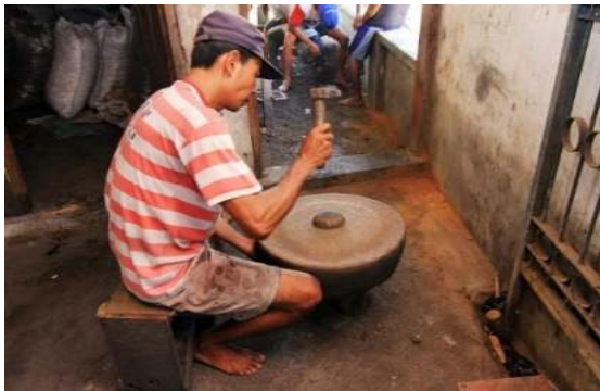
Gambar 5. Proses Pembuatan Gamelan

Gambar berikut ini menunjukkan bagian dari proses pembuatan gamelan yang masih dilakukan secara manual. Proses pembuatan satu item gamelan tidak mudah, umumnya untuk menghasilkan satu item gamelan dibutuhkan 7 hingga 9 pekerja. Selain itu untuk satu set gamelan jawa setidaknya dibutuhkan waktu kurang lebih 4 bulan dalam proses pengerjaannya. Dalam pembuatan gamelan juga dibutuhkan kepekaan indera pendengran pengrajin untuk dapat menghasilkan nada-nada yang akurat.