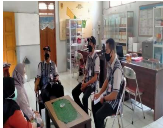
Gambar 3. Diskusi bersama perangkat desa

Kegiatan kami mulai dengan melakukan pertemuan dan diskusi antara tim dan perangkat Desa Wirun yang bertanggungjawab dalam bidang pengembangan gamelan dan wisata desa. Dari diskusi tersebut kami memetakan kebutuhan Desa Wirun dalam upaya meningkatkan kembali daya tarik desa khususnya dalam kerajinan gamelan dan potensi wisata lainnya.