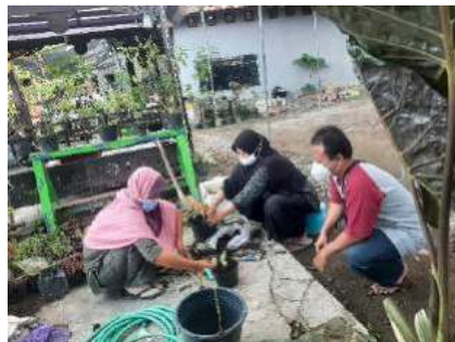
Gambar 6. Kegiatan Utama Berkebun tanaman hias Aglonema