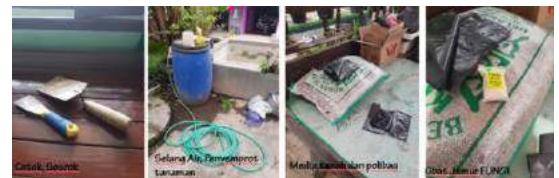
Gambar 4. Peralatan Berkebun