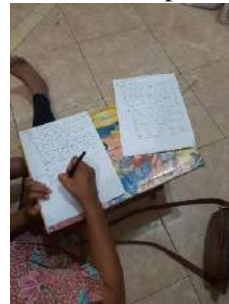
Gambar 5. Penyiapan materi