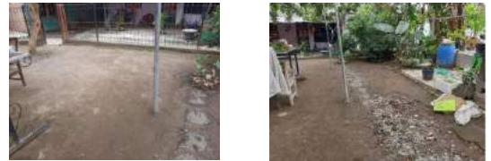
Gambar 3. Lokasi Pengabdian Masyarakat