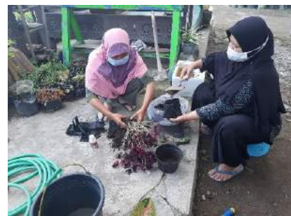
Gambar 7. Kegiatan Utama Berkebun tanaman hias Butterflying / Oxalis