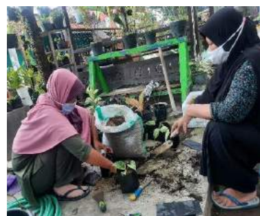
Gambar 8. Kegiatan Utama Berkebun tanaman hias Sirih Marble