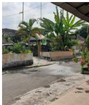
Gambar 1. Maps dan Lokasi Pengabdian Masyarakat

Pelaksanaan dengan metode yang kedua yaitu, Metode pelaksanaan kegiatan yang dilakukan merupakan kegiatan utama yang mendetail :