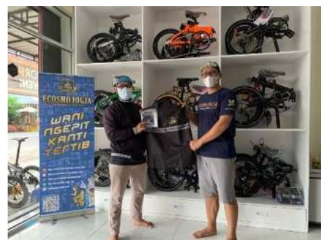
Gambar 12. Serah Terima Souvenir dan Perlengkapan

Pada proses pelaksanaan selanjutnya adalah serah terima perlengkapan dan souvenir untuk komunitas yang dikemas menjadi event gowes bareng sekaligus peresmian basecamp Ecosmo Jogja yang sudah disetujui bersama, sehingga komunitas mempunyai tempat untuk diskusi kedepannya. Adapun beberapa dokumentasi dari kegiatan ini sebagai berikut: