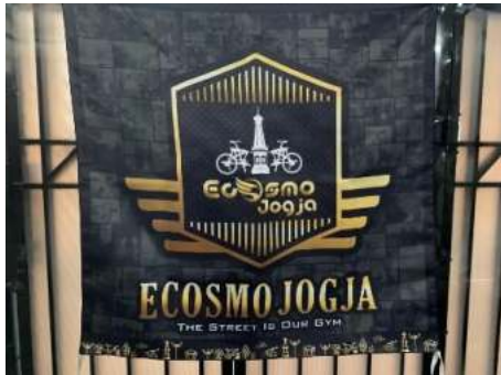
Gambar 8. Realisasi Bendera