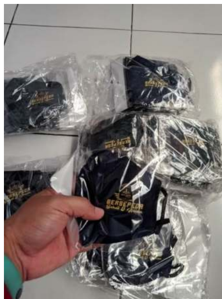
Gambar 6. Realisasi Masker

Dari desain yang sudah dibuat selanjutnya maka dilanjutkan dengan proses pengadaan dan pembuatan dimana dalam hal ini membutuhkan waktu karena ada beberapa bahan yang memang diadakan secara online. Adapun realisasi dari desain diatas bisa dilihat seperti gambar sebagai berikut: