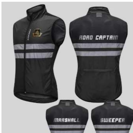
Gambar 3. Desain Rompi