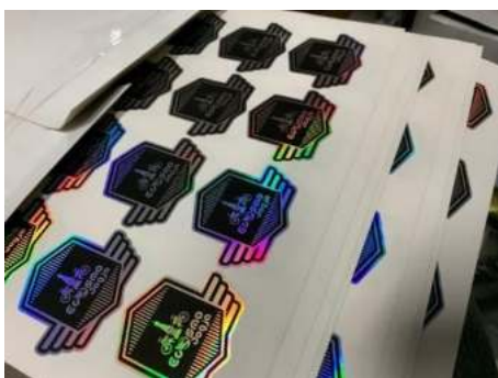
Gambar 10. Realisasi Sticker

Sedangkan untuk pelaksanaan pelatihan terkait penggunaan googledrive dan googlesheet tidak mengalami kendala, dikarenakan untuk anggota yang ditunjuk yaitu saudari tri setyaningsih sudah familiar dengan teknologi selain itu juga pengguna aplikasi google juga, sehingga proses pelatihan bisa berjalan dengan lancar dan cepat.