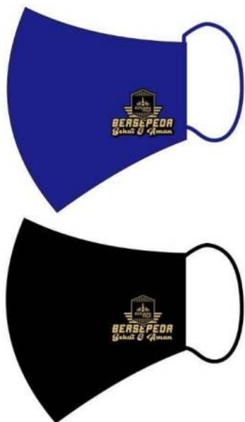
Gambar 2. Desain Masker