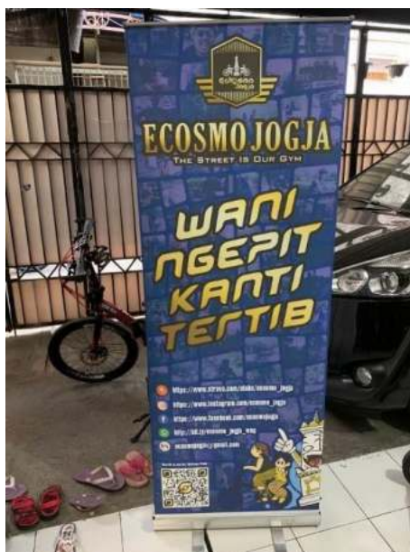
Gambar 9. Realisasi Xbanner