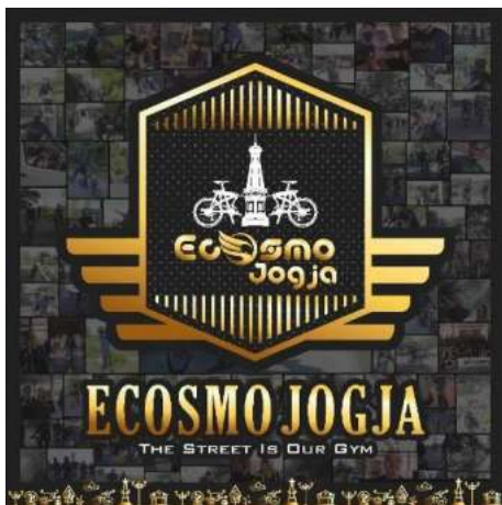
Gambar 4. Desain Bendera

Dari desain yang sudah dibuat selanjutnya maka dilanjutkan dengan proses pengadaan dan pembuatan dimana dalam hal ini membutuhkan waktu karena ada beberapa bahan yang memang diadakan secara online. Adapun realisasi dari desain diatas bisa dilihat seperti gambar sebagai berikut: