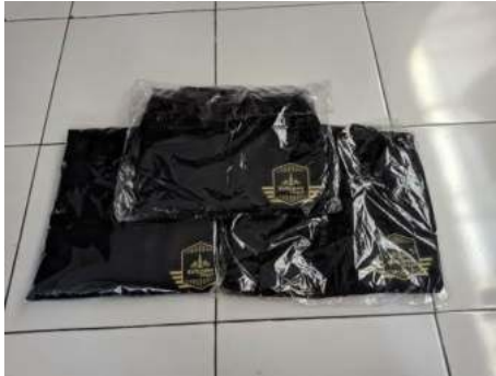
Gambar 7. Realisasi Rompi