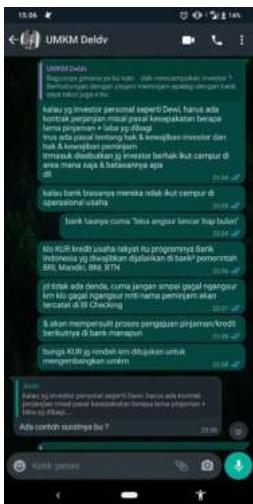
Gambar 2.3. Pendampingan Usaha