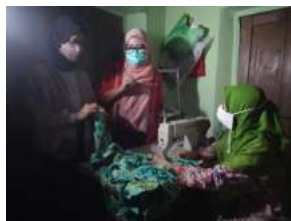
Gambar 2.4. Pendampingan Usaha