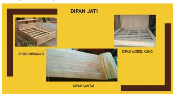
Gambar 4. Katalog Dipan

Pada Gambar 3 diatas menunjukkan halaman Katalog untuk jenis produk meja kursi dengan berbagai model dan ukuran