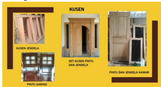
Gambar 6. Katalog Kusen

Pada Gambar 5 ditunjukkan halaman Katalog untuk jenis Produk Lemari dengan berbagai ukuran dan bentuk.