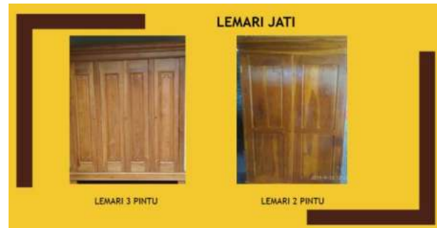
Gambar 5. Katalog Lemari

Pada Gambar 4 ditunjukkan halaman Katalog untuk Jenis Produk Dipan dengan berbagai model dan Ukuran.