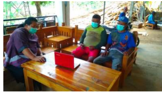
Gambar 7. Pelaksanaan Pelatihan dan Pendampingan

Salah satu solusi dari permasalahan yang dihadapi oleh mitra adalah memberikan pelatihan dan pendampingan pengoperasian google business. Hal ini dilakukan karena pihak pengelola JMKM tidak memiliki sumber daya manusia yang mampu mampuan dalam pengoperasian akun google. Pelatihan dan pendampingan yang diberikan meliputi pengenalan fitur-fitur dan pengaturan pada google business seperti cara mengunggah foto produk, menentukan alamat pada map, mengelola tanggapan dan pertanyaan dari calon pembeli dan semua fitur yang ada pada google business. Dokumentasi pelatihan dan pendampingan yang diberikan kepada pengelola JMKM ditunjukkan pada Gambar 7.