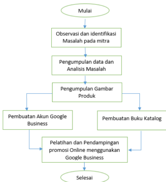
Gambar 1. Alur metode pelaksanaan program pengabdian kepada masyarakat

Pelaksanaan kegiatan Pengabdian Kepada Masyarakat dilakukan dengan melakukan pengamatan dan hasil analisa terhadap permasalahan yang dihadapi oleh UD. JMKM. Alur pelaksanaan Pengabdian Kepada Masyarakat ditunjukkan pada Gambar 2