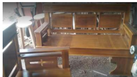
Gambar 1. Produk JMKM

Kecamatan Parang saja. Produk-produk yang di tawarkan oleh JMKM ditunjukkan pada gambar 1 berikut: