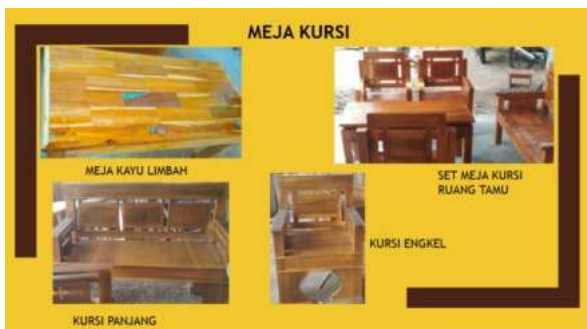
Gambar 3. Katalog Meja dan Kursi

Foto produk yang dikumpulkan akan dikelompokkan sesuai jenis produk yang ada. Katalog yang telah dibuat ditunjukkan pada Gambar 3.