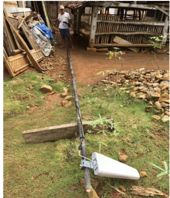
Gambar 2. Antena Sebelum Pemasangan

Pada gambar 2, diperlihatkan antena penguat sinyal dan tiang bambu, serta kabel coaxial yang melilit, sebelum antena tersebut akhirnya dicor dan dipancang dengan kawat yang kuat.