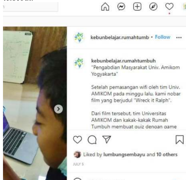
Gambar 7. Peliputan di IG Mitra

Hal yang sangat menarik dari kegiatan ini adalah bagaimana melihat kebahagiaan dan senyum lebar para siswa-siswa yang ikut game kahoot. Beberapa kali terdengar teriakan-teriakan kekecewaan disaat jawaban mereka salah, namun juga sebaliknya, beberapa kali terdengar suara tertawa sumringah sambil sedikit mengejek, ketika siswa tersebut berhasil menjawab dengan benar serta paling cepat. Tentunya hal ini adalah sebuah sinyal positif yang bisa secara langsung dirasakan atas pengabdian masyarakat yang dilaksanakan di desa tersebut. Meskipun juga sayangnya, karena beberapa siswa masih terlalu muda, sehingga mereka tidak diberikan akses ponsel oleh orang tuanya. Sehingga beberapa dari siswa hanya bisa melihat, dan ikut mengganggu temannya yang sedang berlomba menggunakan ponsel mereka masing-masing. Namun, pada pertemuan selanjutnya, siswa-siswa yang tidak memiliki ponsel, diberikan pinjaman laptop oleh kakak-kakak pengelola agar bisa ikut serta dalam pembelajaran kahoot berbasis internet tersebut.