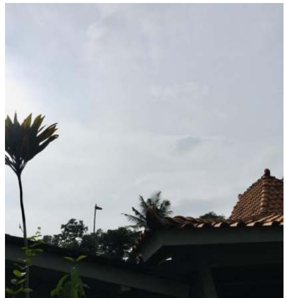
Gambar 3. Antena Setelah Pemasangan

Pada gambar 2, diperlihatkan antena penguat sinyal dan tiang bambu, serta kabel coaxial yang melilit, sebelum antena tersebut akhirnya dicor dan dipancang dengan kawat yang kuat.