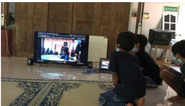
Gambar 5. Ujicoba Koneksi Bersama Siswa

Setelah memastikan koneksi internet melalui wifi sudah cukup stabil, maka pada minggu selanjutnya, tepatnya pada tanggal 4 Juli 2021 diadakan pertemuan secara luring, yang dihadiri beberapa orang tua siswa, siswa-siswa, dan kakak-kakak pengelola, kegiatan ini bisa dilihat pada gambar 5.