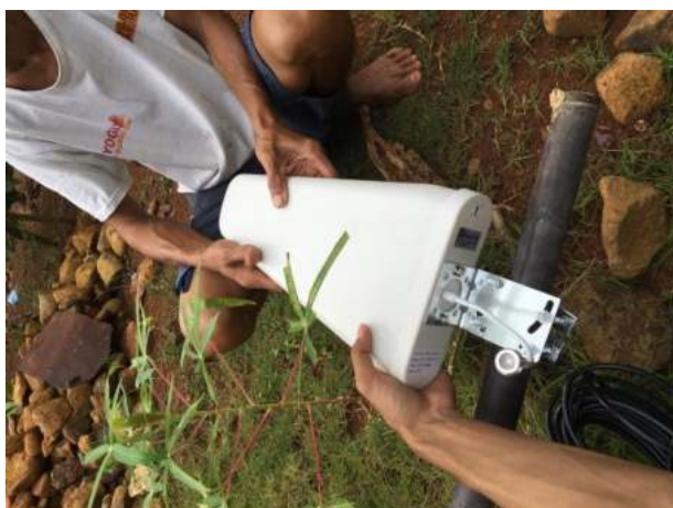
Gambar 1. Pemasangan Antene

Pada gambar 1 diperlihatkan bahwa pemasangan antena penguat sinyal dibantu warga yang kebetulan anaknya juga salah satu siswa yang diwajibkan sekolah daring. Hal ini membuktikan bahwa warga juga sangat mendukung pemasangan wifi umum di joglo tempat mitra pengabdian berada.