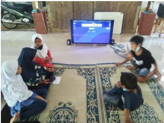
Gambar 6. Siswa Belajar Kahoot

Disamping untuk menguji koneksi internet, para siswa juga didampingi untuk belajar menggunakan media pembelajaran berbasis internet yaitu kahoot dan quizziz. Namun, sebelumnya mereka juga diajak menonton sebuah film animasi berbahasa Inggris. Yang kemudian, materi yang terkandung dalam film animasi tersebut dijadikan soal pada kahoot maupun quizziz, sebagaimana ditampilkan pada gambar 6.