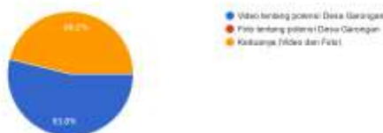
Gambar 3 Harapan media yang dibutuhkan petani dan warga

Dari data tersebut, menjadi alasan kuat bahwa pembuatan video sangat dibutuhkan, dilihat dari rendahnya penggunaan video sebagai media promosi dan tingginya harapan warga dan petani dalam membutuhkan video untuk mengenalkan potensi, keindahan desanya. 100% mengatakan harapan adanya video dan