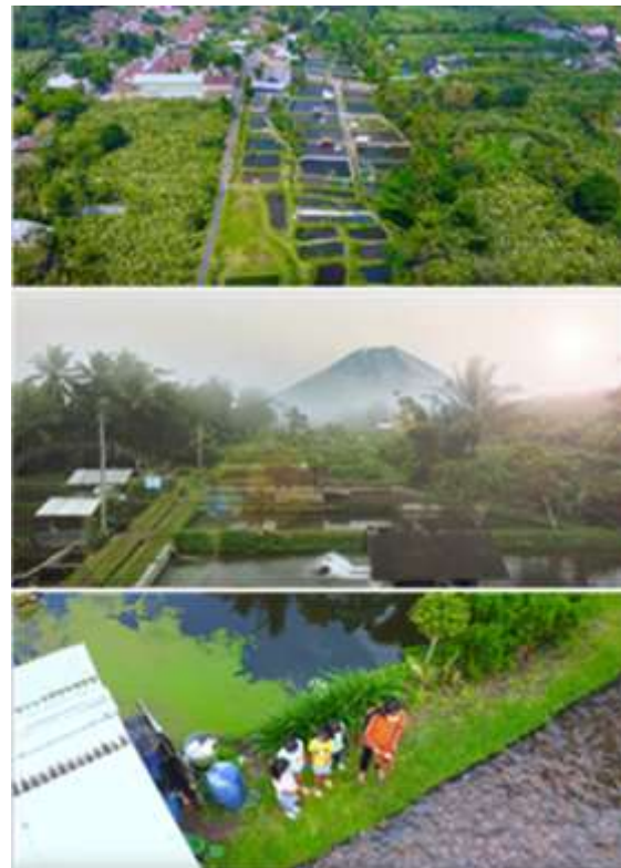
Gambar 4 Foto Potensi Desa Garongan

46,2% perlu didukung adanya foto-foto tentang desa garongan.