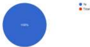
Gambar 1. Persentase promosi desa