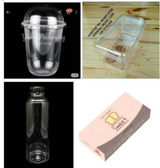
Gambar 4. Contoh Kemasan