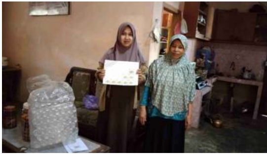
Gambar 5. Mitra