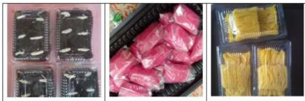
Gambar 1. Produk Anisya