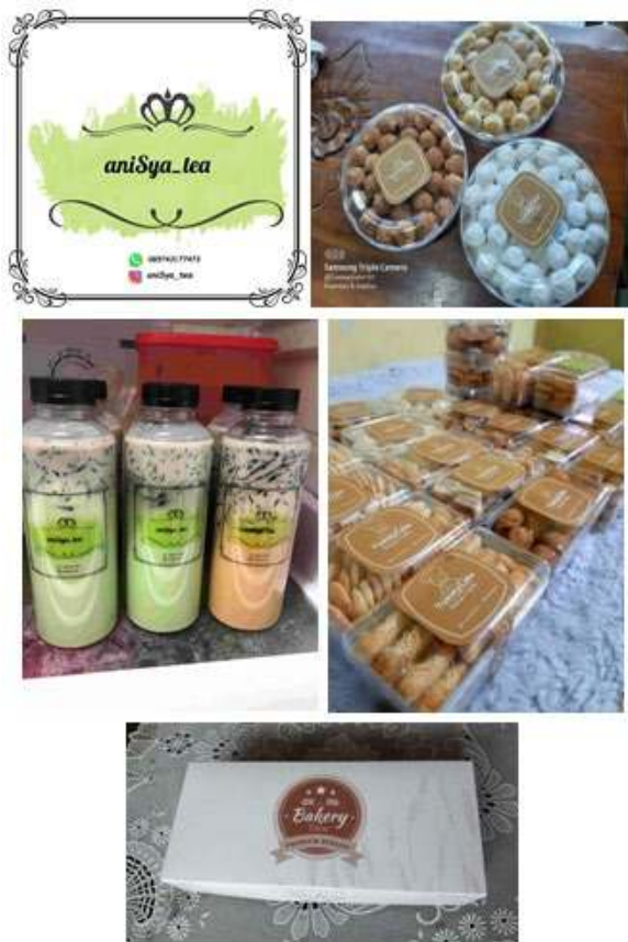
Gambar 6. Implementasi Kemasan