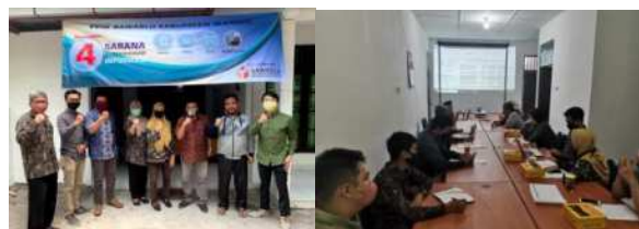
Gambar 1. Hasil diskusi konsep bersama mitra

Berdasarkan penawaran yang diberikan, disini pengabdian mengambil Pelatihan Fotografi dan mengangkat tema “Pelatihan Kemampuan Dasar Fotografi sebagai Media Dokumentasi dan Publikasi bagi Badan Pengawas Pemilihan Umum (Bawaslu) Kabupaten Sleman”.