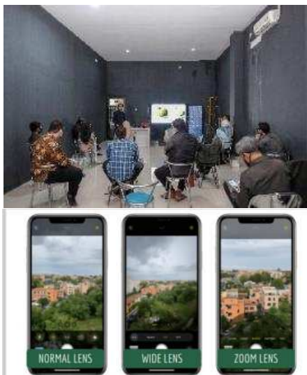
Gambar 4. Pengenalan proses pengambilan gambar menggunakan smartphonw

Dikarenakan terdapat pembatasan sosial maka pelatihan ini dibagi menjadi dua sesi, pagi dan sore. Untuk mengantisipasi kapasitas ruangan yang dibatasi menjadi 50% saja. Pada pelatihan ini merupakan pelatihan tata cara pengambilan foto yang baik dan benar agar informasi yang akan disampaikan ke dalam foto mudah dipahami.