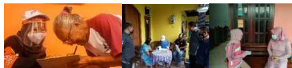
Gambar 5. Kegiatan Coklit (Pencocokan dan Penelitian) yang dilakukan oleh peserta di desa - desa

Panwascam atau Pengawas Kecamatan adalah staff Bawaslu yang bertugas untuk mencatat kegiatan Coklit (Pencocokan dan Penelitian) ketika pendataan daftar hak pilih suara. Disini peserta Panwascam juga memotret dokumentasi yang selama kegiatan tersebut.