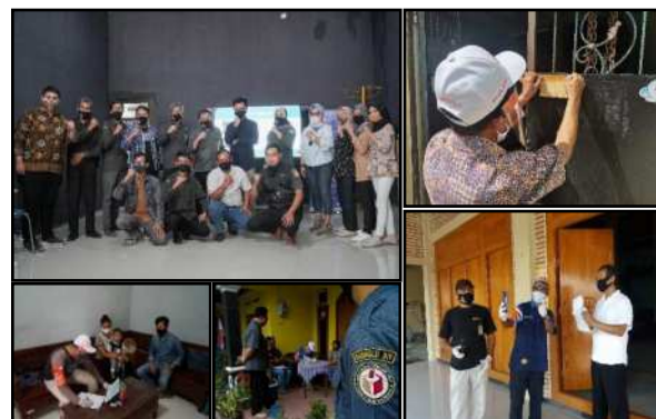
Gambar 6. Kegiatan dasar fotografi lanjut dan bedah foto hasil tugas