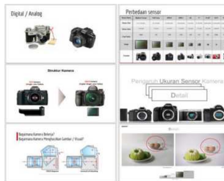
Gambar 2. Pengenalan dasar dan jenis Kamera

Pada tahapan ini pula peserta mencoba mempraktekkan dengan mengambil gambar atau memotret menggunakan kamera professional yang sudah disediakan seperti DSLR, Mirroless, Action Camera, dan Pocket Camera. Diikuti dengan mencoba memotret menggunakan smartphone, sehingga peserta akan paham mengenai perbedaan baik itu penggunaan, hasil gambar, dan juga fleksibilitas dari masing masing kamera. Serta mempelajari dasar pencahayaan dalam fotografi yang meliputi Triangle Exposure , Lighting , dan Moment .