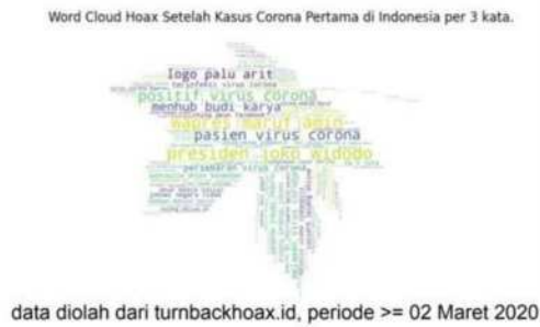
Gambar 10. Wordcloud temuan singkat hoax di Indonesia

Untuk mencapai tujuan utama dari pelatihan, yaitu luaran kemampuan digital forensic dan penelusuran singkat mandiri dari para peserta, pengabdian melakukan uji sederhana menggunakan formulir pertanyaan yang harus dijawab oleh peserta. Dengan contoh pertanyaan seperti terlihat pada gambar 11.