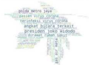
data diolah dari turnbackhoax.id, periode > 19 April 2019 dan < 02 Maret 2020