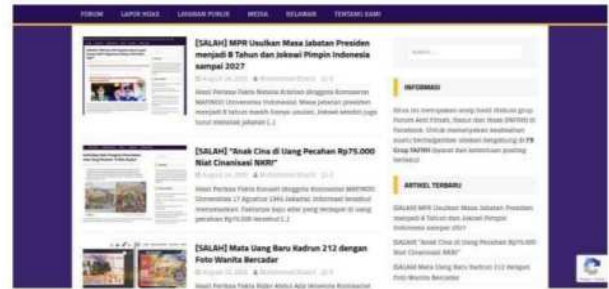
Gambar 12. Tampilan Turnbackhoax.id

SK (Surat Keputusan) Pendirian Perkumpulan NOMOR AHU-0078919.AH.01.07.TAHUN 2016 Menteri Hukum dan Hak Asasi Manusia.