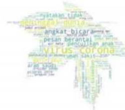
data diolah dari turnbackhoax.id, periode > 19 April 2019 dan < 02 Maret 2020