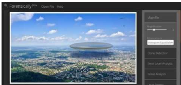
Gambar 15. Tampilan Forensically

Forensically merupakan tools open-source digital image forensics karya Jonas Wagner dari Switzerland.