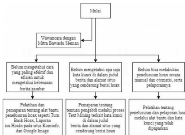
Gambar 1. Alur Pelaksanaan

Dalam proses kegiatan pelatihan penelusuran hoax ini, akan dijabarkan ke dalam alur seperti terlihat pada gambar 1.