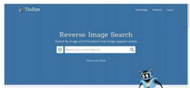
Gambar 14. Tampilan TinEye

Sama seperti Google Image, TinEye berfungsi untuk melakukan reverse image searching menggunakan pendekatan image recognition yang cukup akurat.