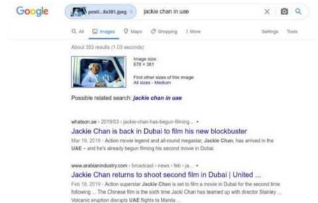
Gambar 13. Tampilan Google Image

Google Image merupakan sub-fitur dari mesin pencari Google yang dikhususkan untuk mencari gambar serupa dari masukan pengguna, sangat berguna untuk mencari informasi keaslian dan asal sebuah foto/gambar.