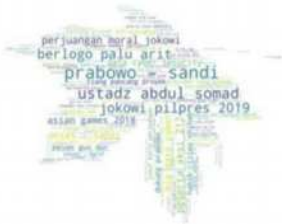
data diolah dari turnbackhoax.id, periode <= 19 April 2019