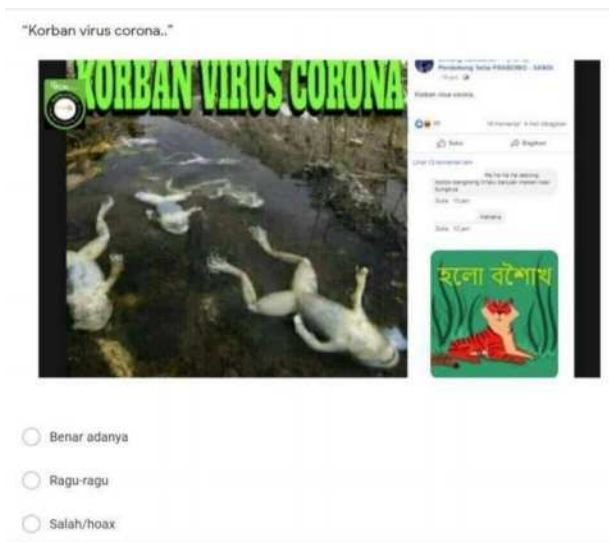
Gambar 11. Contoh pertanyaan digital forensic dan penelusuran hoax

Untuk mencapai tujuan utama dari pelatihan, yaitu luaran kemampuan digital forensic dan penelusuran singkat mandiri dari para peserta, pengabdian melakukan uji sederhana menggunakan formulir pertanyaan yang harus dijawab oleh peserta. Dengan contoh pertanyaan seperti terlihat pada gambar 11.