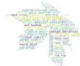
data diolah dari turnbackhoax.id, periode >= 02 Maret 2020