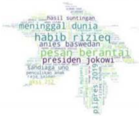
data diolah dari turnbackhoax.id, periode <= 19 April 2019