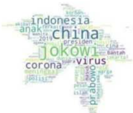
data diolah dari turnbackhoax.id, periode > 19 April 2019 dan < 02 Maret 2020