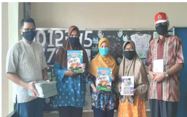
Gambar 2. Penyerahan Buku vektor ke pengelola PAUD dan perwakilan pengurus RT

Dari prioritas masalah mitra maka dalam pengabdian ini memberikan solusi yaitu membuat dan menyajikan media pembelajaran anak dengan Aplikasi Vektor untuk dapat meningkatkan minat belajar anak. Pelaksanaan pengabdian Masyarakat ini dilaksanakan pada hari Selasa tanggal 13 Oktober 2020 dan dihadiri Oleh Pengurus Paud Sokapalupi dan perwakilan pengurus RT 02 RW 09 Minomartani Ngaglik Sleman Yogyakarta. Pada kegiatan kali ini pengabdian membagikan Buku yang berisi gambar vector untuk digunakan Siswa PAUD dalam pembelajaran di rumah.