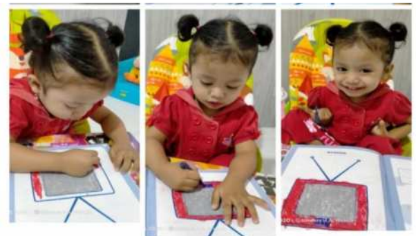
Gambar 4. Murid PAUD dalam belajar 1

Setelah buku telah terdistribusi dengan baik kemudian diadakan pertemuan secara online dengan ZOOM untuk diberikan arahan cara pengisian dan penggunaan buku latihan, hal ini perlu dilakukan mengingat masih kurangnya pemahaman orang tua wali terhadap pengetahuan atau teknologi online yang digunakan dalam pembelajaran selama masa covid 19.