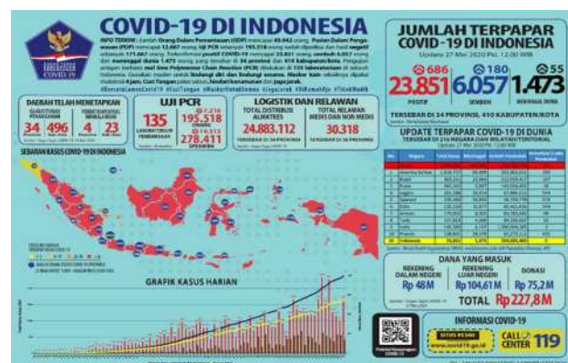
Gambar 1 Infografis kasus Covig 19 di Indonesia

sebanyak 686 orang sehingga totalnya menjadi 23.851. Sedangkan pasien sembuh menjadi 6.057 setelah ada penambahan 180 orang dan kasus meninggal menjadi 1.473 dengan penambahan 55 orang [1].