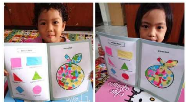
Gambar 5. Murid PAUD dalam belajar 2

Selanjutnya 1 minggu kemudian siswa diminta untuk memberikan laporan kepada pengelola PAUD kemudian oleh pengelola PAUD diberikan kepada pengabdian untuk dievaluasi. Berikut data seluruh peserta PAUD Sokapalupi Minomartani