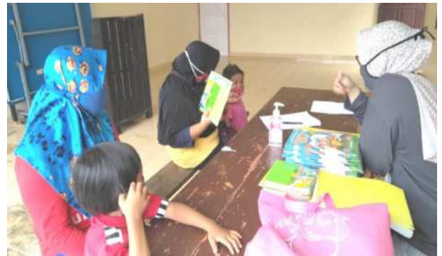
Gambar 3. Pembagian Buku Gambar kepada Murid

Buku kemudian didistribusikan oleh pengelola PAUD secara offline di Balai RT 02 yang diambil oleh perwakilan peserta didik dengan protokol kesehatan Covid 19, diantaranya adalah wajib menggunakan masker, mencuci tangan dan menjaga jarak.