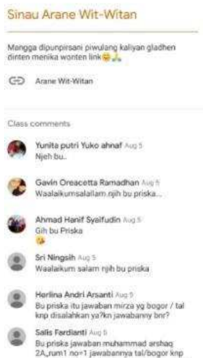
Gambar 4. Pemanfaatan Classroom

Saat ini, semua kelas pada SD Muhammadiyah Kadisoka pelaksanaan daringnya telah menggunakan Google Classroom sebagai media kelas virtualnya. Berisi materi pembelajaran, video penjelasan, maupun penugasan daringnya. Dan kelas 4 sampai kelas 6