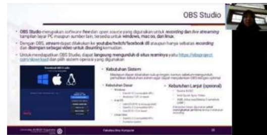
Gambar 5. Video tutorial penggunaan OBS