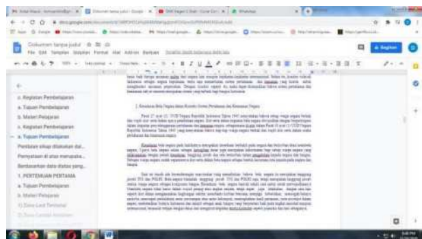
Gambar 6. Penggunaan Google Docs Oleh Peserta

Adapun pada pelatihan ini terdapat beberapa kendala yang dialami para peserta pelatihan, yang pertama yaitu masalah teknis berupa pemadaman listrik pada waktu pelatihan dilaksanakan di lokasi sekitar SMK Negeri 1 Temanggung sehingga harus dilakukan penjadwalan ulang. Dan juga terdapat beberapa kendala kecil dalam implementasi, terutama dalam membuat video bahan ajar. Kendala utama adalah masalah teknis pada perangkat komputer yang tidak sesuai dengan kebutuhan sistem untuk dapat di-install OBS Studio, dengan terpaksa beberapa peserta tidak dapat mempraktikkan pembuatan video bahan ajar.