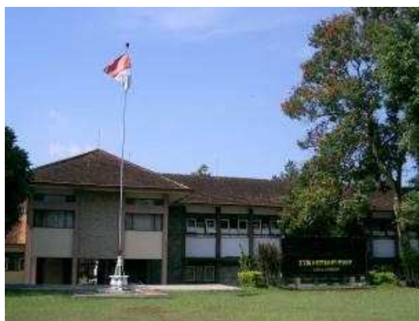
Gambar 1. Gedung SMK Negeri 1 Temanggung

SMK Negeri 1 Temanggung dirintis sejak tahun 1969 dengan nama Proyek Pelita Sekolah Teknik Menengah (STM) Pembangunan Pertanian Temanggung, yang beralamatkan di Jl. Kadar Maron PO BOX 104 Temanggung - Jawa Tengah. Awal mula bernama STM Pembangunan yang mulai menerima siswa baru tahun 1973, dan secara resmi STM Pembangunan berdiri pada tahun 1975 berdasarkan Surat keputusan Menteri Pendidikan dan Kebudayaan Republik Indonesia No. 0310/O/1975, tanggal 31 Desember 1973 dengan program keahlian awalnya hanya Teknologi Pengolahan Hasil Pertanian (TPHP), sampai saat ini sudah menambah 2 program keahlian lagi yaitu Agribisnis Tanaman Perkebunan (ATP) dan Kimia Analisis (KA) [1].