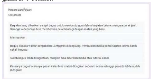
Gambar 7. Feedback Peserta Pengabdian

Peserta juga cukup antusias dalam mengikuti pelatihan, dapat dilihat dari feedback yang diberikan setelah mengikuti pelatihan seperti pada gambar 6 berikut.