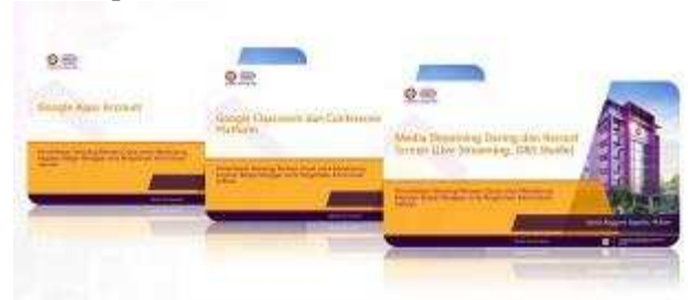
Gambar 5. Modul-modul Pelatihan

Modul – modul tersebut diharapkan dapat membantu peserta dalam mempelajari lebih lanjut setelah pelatihan dilaksanakan.