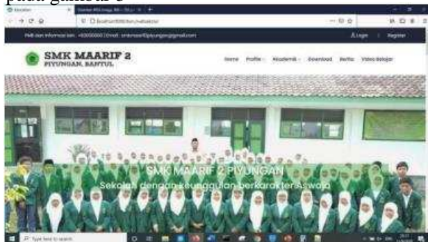
Gambar 4. Halaman Depan Website

Dalam pelaksanaan pengabdian ini telah mendapatkan beberapa hasil yang telah dilakukan, yang paling utama adalah terciptanya sebuah website sekolah untuk SMK Maarif 2 Piyungan. Dimana feature utama website sekolah ini adalah penyampaian pengumuman, berita, materi pembelajaran dan juga video pembelajaran. Website ini juga sebagai wadah promosi dan informasi terkait sekolah bahkan informasi penerimaan siswa baru dapat ditampilkan. Berikut adalah hasil dari pembuatan website ditunjukkan pada gambar 3