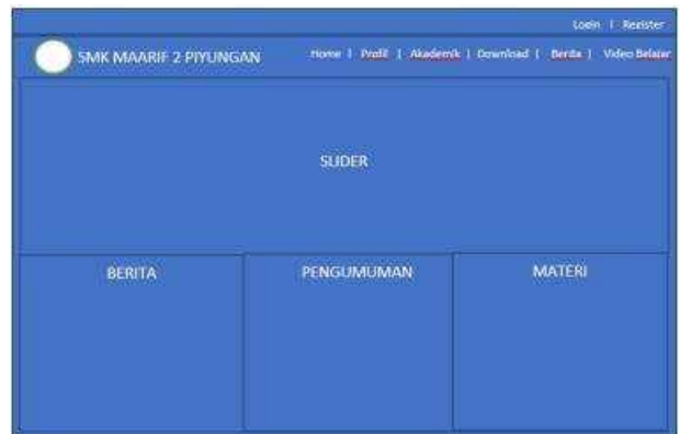
Gambar 3. Rancangan Tampilan halaman Depan

Pada gambar 3 menunjukkan bahwa rancangan halaman depan terdiri dari Logo Sekolah, Menu Link feature yang diinginkan dan juga daftar informasi penting yang harus dimunculkan.