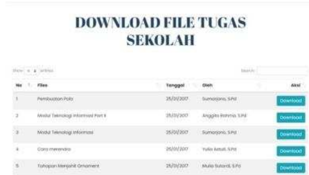
Gambar 6. Feature Pengumuman

Tahapan implementasi dan uji coba dilakukan setelah dirasa semua feature berjalan dengan baik dan telah sesuai kebutuhan sekolah. Maka dilakukan penyerahan website ini kepada sekolah diwakili oleh salah satu Guru sebagai operator. Pelaksanaan tersebut ditunjukkan pada gambar 7.