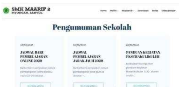
Gambar 5. Feature Pengumuman

Berdasarkan kebutuhan yang telah dijabarkan sebelumnya, bahwa terdapat feature profi dan akademik sebagai pusat informasi, kemudian feature Download dan Video pembelajaran sebagai saran pembelajaran jarak jauh atau pembelajaran Online.