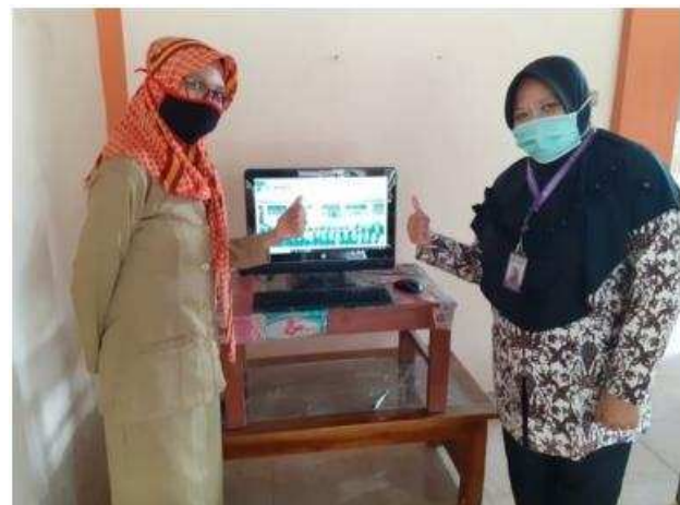
Gambar 7. Gambar Serah terima Website Sekolah

Tahapan implementasi dan uji coba dilakukan setelah dirasa semua feature berjalan dengan baik dan telah sesuai kebutuhan sekolah. Maka dilakukan penyerahan website ini kepada sekolah diwakili oleh salah satu Guru sebagai operator. Pelaksanaan tersebut ditunjukkan pada gambar 7.