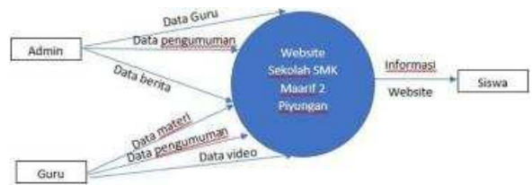
Gambar 2. Diagram Context

Diagram Context ditunjukkan pada gambar 2,