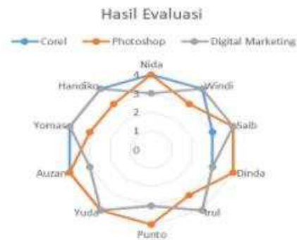
Bagan 2. Hasil Evaluasi Kemampuan Peserta Pelatihan Desain Grafis dan Digital Marketing Setelah Selesai Pelatihan

Setelah selesai diselenggarakannya pelatihan desain grafis dan digital marketing untuk seluruh peserta pelatihan dilakukan evaluasi untuk melihat progres kemampuan peserta dalam membuat desain grafis. Adapun hasil evaluasi peserta pelatihan adalah seperti dalam grafik dibawah ini :