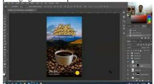
Gambar 4. Pelatihan Sesi 4 dengan materi lanjutan Adobe Photoshop

Pelatihan sesi 4 berlangsung pada tanggal 20 Juli 2020, dengan materi lanjutan Adobe Photoshop. Adapun materi pada sesi 4 ini adalah pembuatan packaging dan mock up.