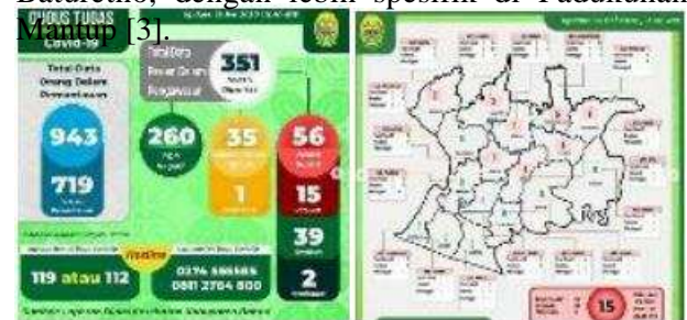
Gambar 1. Data Penduduk Bantul yang terkena Covid-19 pertanggal 28 Mei 2020

Baturetno, dengan lebih spesifik di Padukuhan