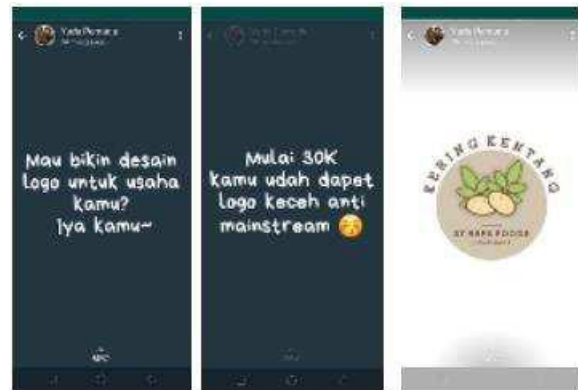
Gambar 8. Promo Usaha Desain Grafis berikut contoh desainnya oleh peserta pelatihan

Setelah dilakukan pelatihan desain grafis dan digital marketing ini beberapa peserta pelatihan langsung mendirikan usaha desain grafis, yang dipimpin oleh saudara Bima Prabawa Yuda Usodo (Yuda).