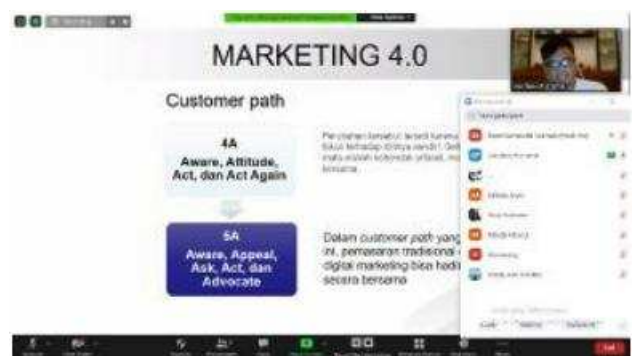
Gambar 5. Pelatihan Sesi 5 dengan Materi Digital Marketing

Pelatihan sesi 5 berlangsung pada tanggal 22 Juli 2020, dengan materi Digital Marketing. Narasumber dari pelatihan ini adalah Bapak Gardana Purnama, ST. beliau merupakan Penyuluh Perindustrian dan Perdagangan dari Dinas Perdagangan Kabupaten Bantul.