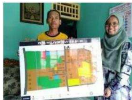
Gambar 9. Penyerahan Peta Wilayah RT 8 Secara Simbolis kepada Bapak Ketua RT

Selain pelatihan desain grafis dan digital marketing yang dilakukan untuk warga padukuhan Mantup, dilakukan juga pembuatan peta wilayah Mantup RT 8 atas permintaan dari Bapak Ketua RT. Peta tersebut dibuat berdasarkan semakin banyaknya jumlah rumah sehingga melakukan pendataan ulang mengenai penomoran rumah.