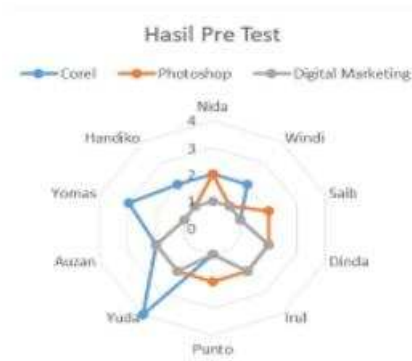
Bagan 1. Tingkat Kemampuan Peserta sebelum Pelatihan

Pada tanggal 12 Juli 2020, pemberian kuota paket data kepada peserta pelatihan. Pemberian paket data diwakilkan oleh Bima Prabawa Yuda Usodo (Yuda). Pelatihan sesi 1 dimulai pada tanggal 13 Juli 2020 dengan materi Corel draw. Narasumber pada pelatihan adalah Yosa Tristian Mahardika yang merupakan mahasiswa Arsitektur Universitas Amikom Yogyakarta. Pelatihan berlangsung secara online dengan menggunakan zoom meeting.