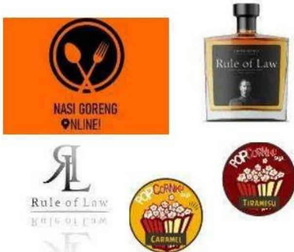
Gambar 6. Contoh Hasil Karya Peserta Pelatihan

Peserta pelatihan mendapatkan tugas untuk mempraktekkan membuat sebuah karya baik dari corel maupun photoshop dari pelatihan yang telah diikuti dan untuk memotivasi peserta maka diadakan kompetisi pembuatan desain.