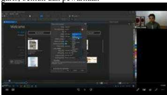
Gambar 1. Pelatihan Sesi 1 dengan Materi Corel Draw

Materi dalam sesi 1 tentang Corel Draw diawali dengan pengenalan toolbar, mengatur size, kertas, buku kerja, mensetting transparansi dan warna. Kemudian diisi dengan pengenalan font, pembuatan garis, bentuk dan pewarnaan