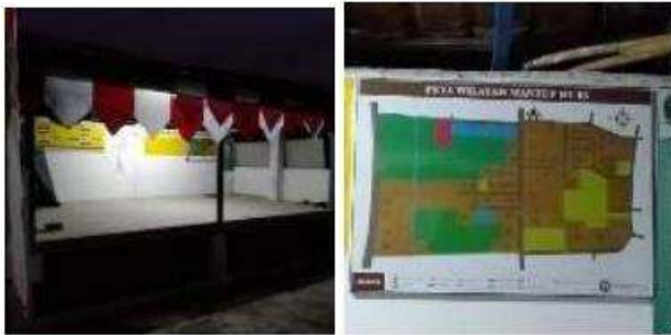
Gambar 10. Peletakan Peta Wilayah Mantup RT 08 di Pos Ronda

Setelah Peta Wilayah diserahkan kepada Ketua RT 08 Mantup, Peta tersebut diletakkan di Pos Ronda yang terletak di Jalan Rukun Bakti yang merupakan jalan utama agar mudah di lihat oleh masyarakat.