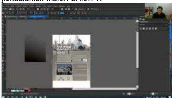
Gambar 2. Pelatihan Sesi 2 dengan materi lanjutan corel draw tentang pembuatan poster

Pelatihan sesi 2 berlangsung pada tanggal 15 Juli 2020, dengan materi lanjutan corel draw, adapun materi detail dalam pelatihan sesi 2 ini adalah pembuatan desain kartu nama dan poster dan pendalaman materi di sesi 1.