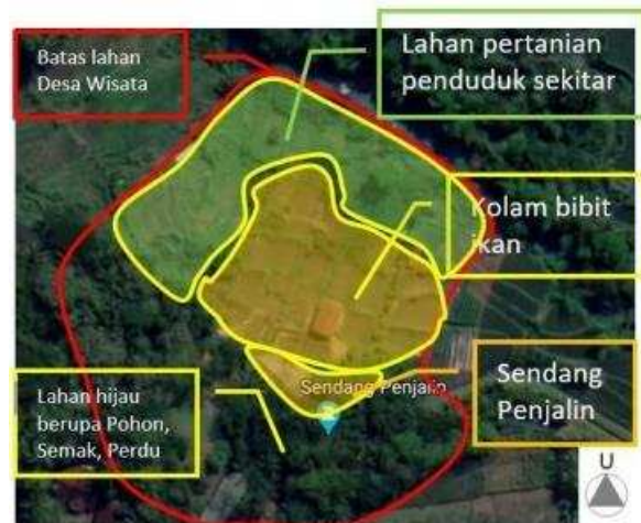
Gambar 6. Kondisi Eksisting Desa Wisata

b. Detail kondisi tempat pengabdian masyarakat dimana kondisi eksisting seperti gambar dibawah ini: