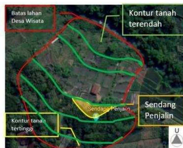
Gambar 7. Kondisi Eksisting Tanah

c. Kondisi eksisting tanah di lokasi berkontur landai (tidak curam) seperti gambar dibawah ini: