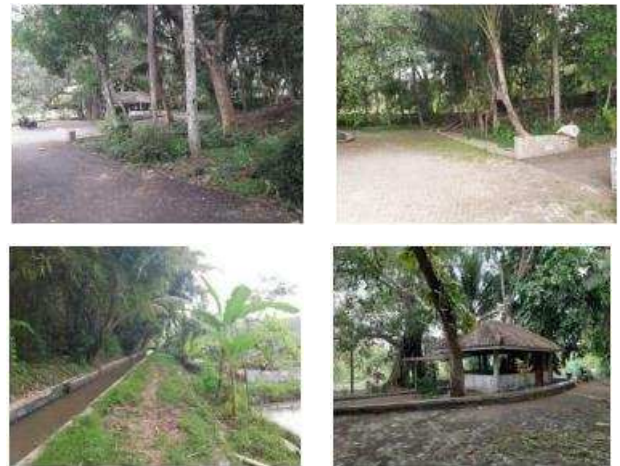
Gambar 3. Detail Kondisi Tempat Pengabdian Masyarakat