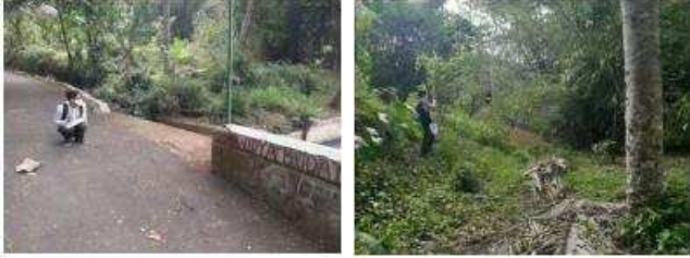
Gambar 4. Survey Lapangan

Kegiatan yaitu pengamatan, dokumentasi dan pengukuran meliputi :