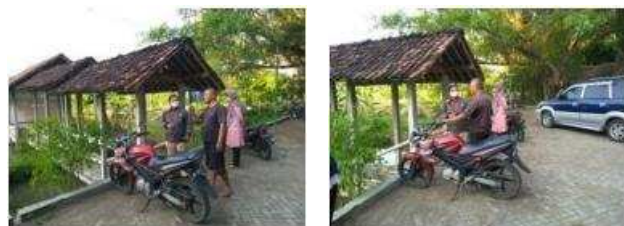
Gambar 2. Survey Lapangan

b. Survey lapangan pada hari yang sama Rabu, 9 September 2020 dengan pengamatan, dokumentasi foto dengan kamera HP dan diharapkan memunculkan gejala-gejala pada 15.30 di desa Sendangrejo, Kecamatan Minggir, Kabupaten Sleman DIY