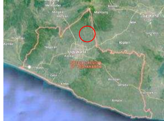
Gambar 1.2.1. Peta DIY dan Desa Selomartani

Desa Selomartani memiliki batas wilayah yang terdiri dari sebelah Utara yaitu Desa Widodomartani, Bimomartani, Kecamatan Ngemplak, sebelah Timur yakni Desa Tamanmartani kecamatan Kalasan, sebelah Selatan yakni Desa Purwomartani, Tirtomartani dan Tamanmartani kecamatan Kalasan dan sebelah Barat yakni Desa Wedomartani Kecamatan Ngemplak.