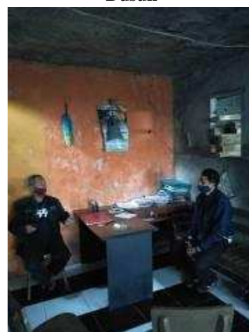
Gambar 2.1. Kegiatan Koordinasi Dengan Kepala Dusun