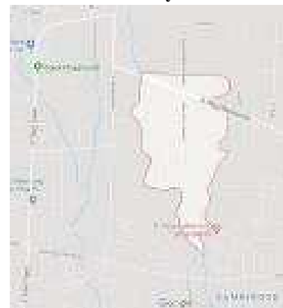
Gambar 1.2.2. Peta Wilayah Dusun Sambirejo