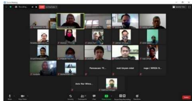
Gambar 2. Pelaksanaan Telekonferensi Melalui Aplikasi Zoom

Kegiatan di hari pertama dimulai dengan melakukan telekonferensi melalui aplikasi Zoom dengan materi dasar pemrograman website. Peserta pelatihan dijelaskan mengenai pengenalan pengertian website (web), komponen dalam web, front end dan backend , jenis-jenis web, perbedaan web statis & dinamis, pengenalan HTML, CSS, dan JS.