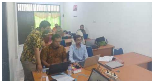
Gambar 3. Pelatihan Secara Luring

Rencana awal, pada hari keempat peserta akan diajarkan mengenai desain responsive untuk website mobile. Tapi berdasarkan hasil evaluasi, kurang dari 50% peserta yang mampu mengimplementasi materi yang diajarkan sebelumnya. Sehingga, pada hari keempat lebih banyak mengulang kembali materi yang sudah diajarkan sebelumnya tapi dengan pendampingan secara langsung dan lebih fokus.