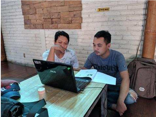
Gambar 7. Pelatihan Pengelolaan Website Oleh Anggota