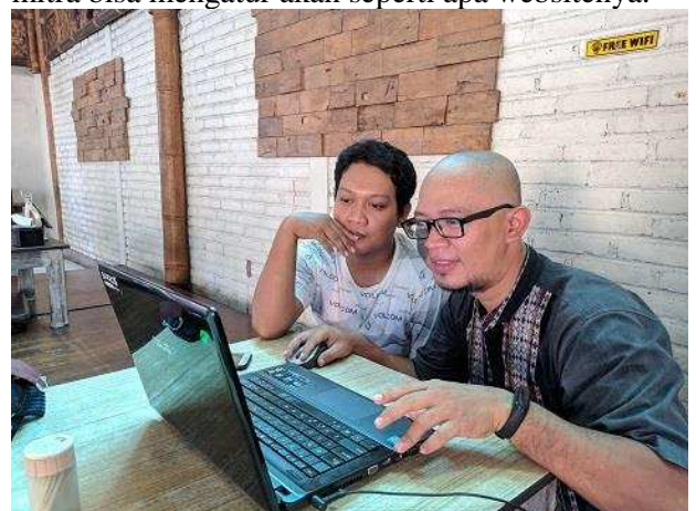
Gambar 6. Pelatihan Pengelolaan Website

Selain penyerahan modul pengelolaan website, juga dilaksanakan pelatihan untuk pengelolaan dan pengaturan website kepada mitra agar kedepannya mitra bisa mengatur akan seperti apa websitenya.