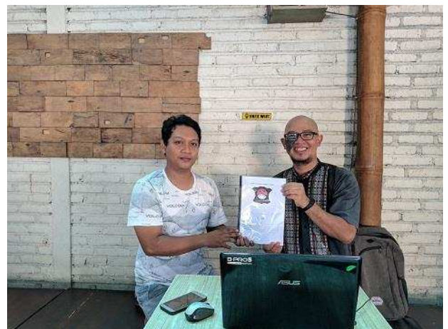
Gambar 5. Penyerahan Modul Pengelolaan Website

Selain penyerahan modul pengelolaan website, juga dilaksanakan pelatihan untuk pengelolaan dan pengaturan website kepada mitra agar kedepannya mitra bisa mengatur akan seperti apa websitenya.