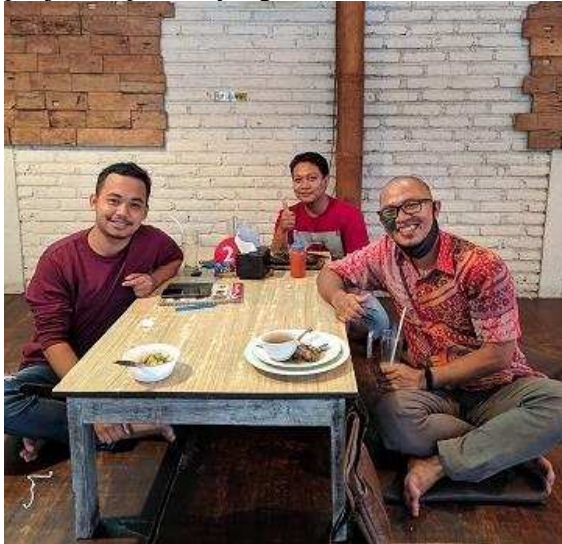
Gambar 2. Koordinasi Penjelasan tentang Website

Adapun materi yang disampaikan terkait apa itu website, manfaat website untuk pemasaran, katalog digital sampai manajemen transaksi penjualan produk yang terekam.