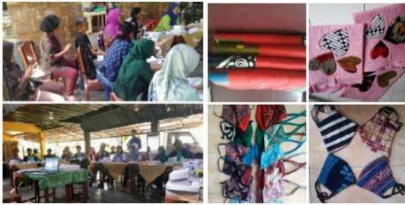
Gambar 2.2. Pendampingan Usaha