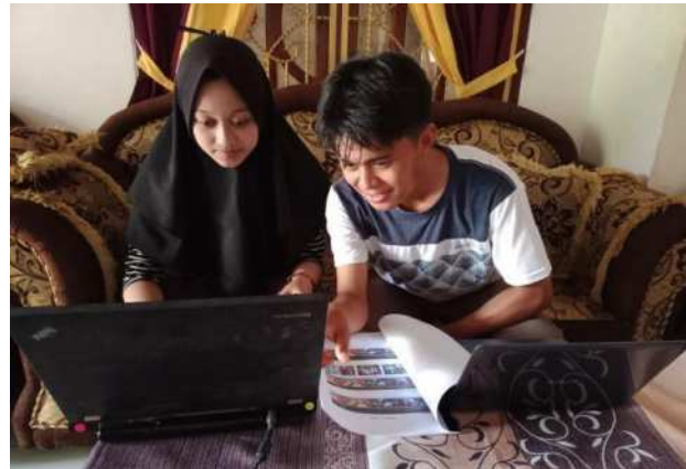
Gambar 4. Mitra mencoba dan membuka website dnummahcraft

Pelaksanaan Pengenalan website kepada mitra dilakukan dengan langsung mencoba untuk membuka dan mengenali website kepada mitra, ditunjukkan pada gambar 4 sebagai berikut :