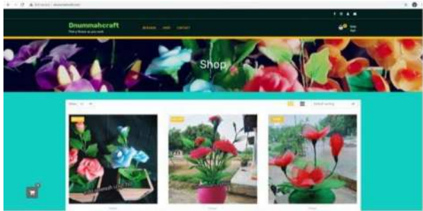
Gambar 6. Halaman website

Perancangan website untuk media promosi pada UKM dnummahcraft dibangun dengan menggunakan CMS wordpress. Adapun halaman atas website ditunjukkan pada gambar 6.