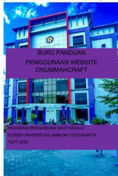
Gambar 5. Halaman sampul Buku panduan Website

Adapun cara lain untuk pelaksanaan pengenalan website kepada mitra dilakukan dengan menggunakan modul “Buku Panduan Penggunaan Website dnummahcraft.” dapat dilihat pada gambar 5. sebagai berikut: