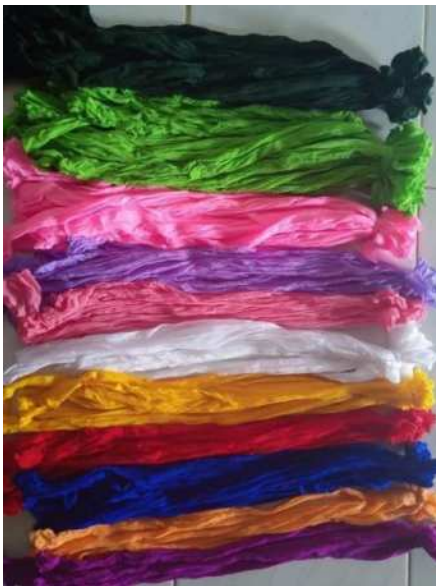
Gambar 1. Bahan Produksi

DNummah craft adalah usaha kecil pengrajin tanaman hias bunga dengan berbagai macam dan jenis tanaman hias, berawal dari hobi dan mengisi waktu kosong mencoba membuat tanaman hias berupa bunga lalu di upload di media social whatsapp ternyata ada yang tertarik oleh produk tersebut, lalu mbak Diyah Nur Ummah membuka usaha ini pada Awal tahun 2020 lalu, kali ini DNummah craft beralamatkan di Desa Binakarya Putra, Kecamatan Rumbia, Kabupaten Lampung Tengah, Lampung kode post 34157. DNummah craft ini jaraknya ± 16 kilometer dari kantor kecamatan rumbia lampung tengah dan ± 863 kilo meter dari Universitas Amikom Yogyakarta.