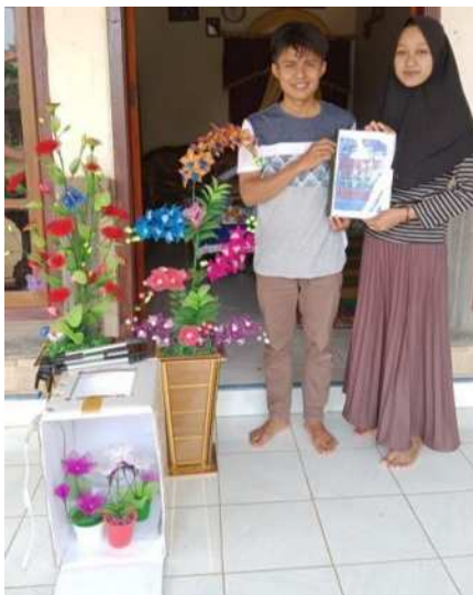
Gambar 7. Penerapan Website dan Penyerahan Buku Panduan

Pada proses penerapan website, mitra menginginkan nama websitenya yaitu dnummahcraft.com kemudian dicarikan nama domain tersebut dan penyerahan buku panduan dan beberapa komponen penunjang untuk teknik digital marketing sudah diserahkan seperti yang ditunjukkan pada gambar 7.