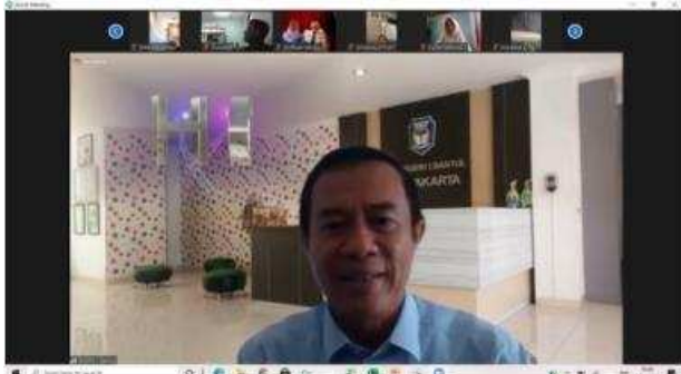
Gambar 2. Pengarahan Program Sekolah di Masa Pandemi

ketat, yaitu hanya 10 siswa untuk setiap kelas dan hanya dilaksanakan satu minggu sekali. Program ini bukan merupakan program pengganti pembelajaran jarak jauh, akan tetapi sebagai pelengkap dari sistem pembelajaran jarak jauh yang sudah ada.