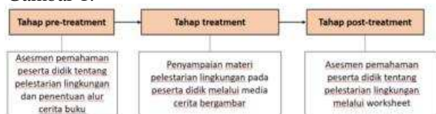
Gambar 1. Metode pelaksanaan

Objek dalam kegiatan ini adalah peserta didik di PG/TKIT Muadz bin Jabal dengan interval umur 4 – 6 tahun. Dalam interval umur tersebut, peserta didik berada pada tingkat Taman Kanak Kanak. Kegiatan pengabdian masyarakat ini secara umum mencakup tiga tahap yaitu tahap pre-treatment, tahap treatment dan tahap post-treatment. Tahap pre-treatment merupakan tahap awal penilaian pemahaman peserta didik terhadap kelestarian lingkungan serta penentuan alur cerita. Tahap treatment merupakan tahap penerapan teknologi berupa cerita bergambar. Tahap post-treatment merupakan tahap uji pemahaman peserta didik tentang pelestarian lingkungan setelah dilakukan penyampaian materi melalui cerita bergambar. Tahapan dalam kegiatan ini disajikan dalam Gambar 1.