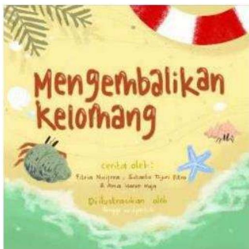
Gambar 2. Cover buku cerita

Cerita bergambar disajikan menjadi sebuah buku dan video cerita (Gambar 2 dan Gambar 3). Penyampaian materi melalui membaca buku tidak mungkin untuk dilakukan karena kondisi pandemi dan pembelajaran online. Oleh karena itu penyampaian materi ini dilakukan melalui media video. Cerita bergambar tersebut divisualisasikan melalui video cerita dan didistribusikan melalui e-learning sekolah. Buku cerita bergambar tetap dicetak dan diserahkan ke sekolah sebagai media pembelajaran dan koleksi perpustakaan sekolah (Gambar 4).