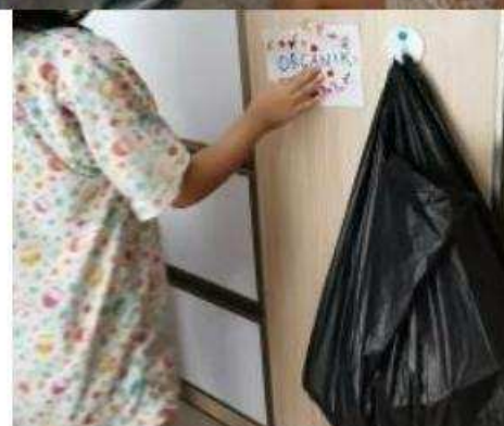
Gambar 6. Peserta didik memberikan label tempat membuang sampah organik dan anorganik

Worksheet berupa perilaku hemat plastik dibagikan melalui e-learning sekolah. Peserta didik diberikan gambar yang mencerminkan perilaku hemat plastik dan boros plastik. Gambar yang mencerminkan