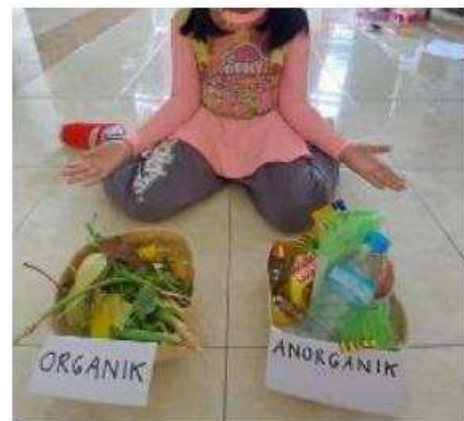
Gambar 5. Peserta didik memilah sampah organik dan anorganik

Keseluruhan peserta didik telah memahami kategori sampah organik dan anorganik. Peserta didik memisahkan sampah organik dan anorganik yang ada di rumah masing-masing (Gambar 5). Selain itu, peserta didik juga memberikan label pada tempat membuang sampah organik dan anorganik yang ada di rumah masing-masing (Gambar 6).