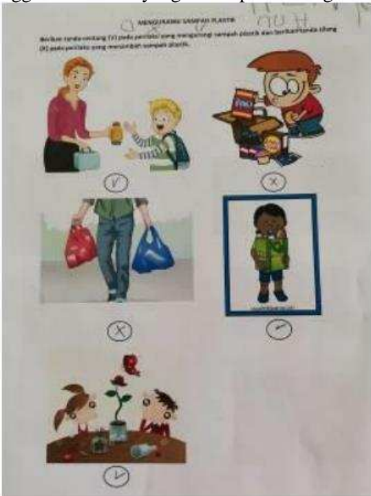
Gambar 7. Contoh hasil pengerjaan worksheet pengurangan sampah plastik

perilaku hemat plastik diberikan centang (v), sedangkan gambar yang mencerminkan perilaku boros plastik diberikan tanda silang (x). Peserta didik telah memahami perilaku menghemat plastik dan boros plastik (Gambar 7). Beberapa perilaku sudah dipraktikkan oleh peserta didik ketika sekolah offline seperti membawa bekal air minum menggunakan botol yang bisa dipakai ulang.