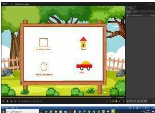
Gambar1. Gabungan bentuk untuk gambar

Selanjutnya ada gambar mobil yang merupakan penggabungan bentuk persegi panjang, segitiga dan lingkaran, serta gambar jeruk dan lemari.