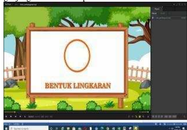
Gambar 2. Bentuk Lingkaran

Tayangan video diawali dari menampilkan gambar bentuk lingkaran, oval, persegi, persegi panjang, segitiga, segilima, segi enam, segi tujuh, jajaran genjang dan belah ketupat.