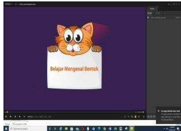
Gambar 1. Tampilan awal video pembelajaran

Tayangan video diawali dari menampilkan gambar bentuk lingkaran, oval, persegi, persegi panjang, segitiga, segilima, segi enam, segi tujuh, jajaran genjang dan belah ketupat.