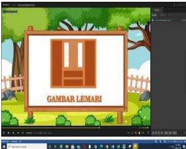
Gambar 5. gambar lemari

Selanjutnya ada gambar mobil yang merupakan penggabungan bentuk persegi panjang, segitiga dan lingkaran, serta gambar jeruk dan lemari.