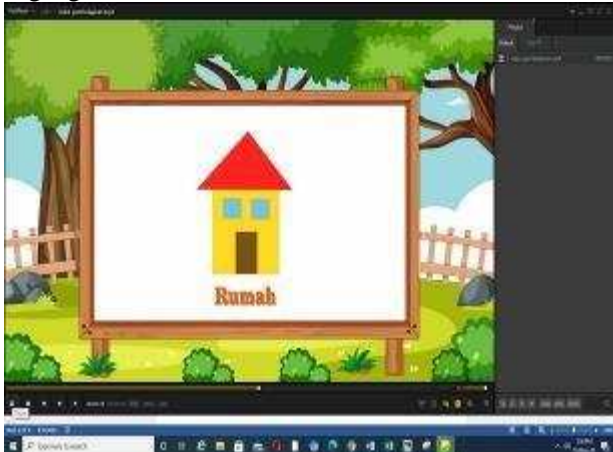
Gambar 4. gambar rumah

seperti gambar rumah yang merupakan penggabungan bentuk persegi, persegi panjang dan segitiga.