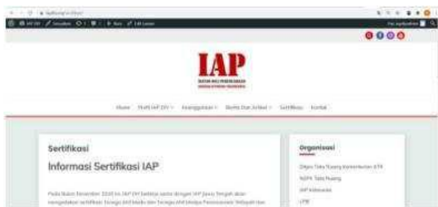
Gambar 3. Halaman sertifikasi

Langkah selanjutnya adalah memberikan tutorial singkat menu-menu edit dalam pengelolaan website berbasis wordpress yaitu dengan mengenalkan beberapa menu pada halaman admin sebagai berikut: