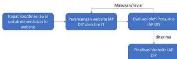
Gambar. Metode pelaksanaan perancangan website IAP DIY

Di tengah pandemi Covid-19 ini, beberapa rapat dapat dilaksanakan secara virtual. Namun apabila pihak mitra menghendaki untuk bertemu secara langsung maka tim pengabdian masyarakat dapat bertemu dengan mitra dengan syarat menetapkan protokol kesehatan Covid-19. Adapun secara umum metode pelaksanaan kegiatan ini adalah sebagai berikut: