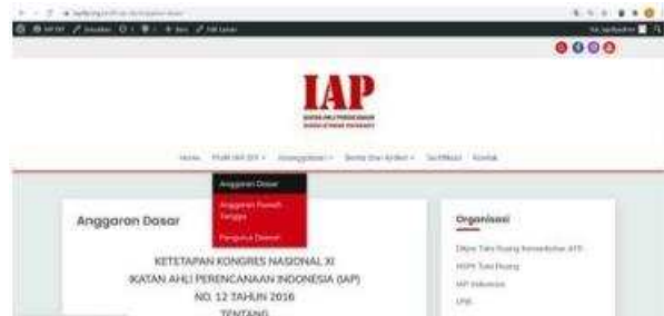
Gambar 1. Halaman profil IAP DIY

Setelah melakukan beberapa perubahan tersebut maka kemudian website IAP DIY dapat diterima oleh Pengurus IAP DIY. Adapun muatan dalam website IAP DIY adalah sebagai berikut: