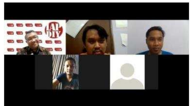
Gambar. Zoom Meeting dengan pengurus IAP DIY

Berdasarkan hasil pertemuan awal dalam menentukan tema website, dari mitra meminta sebaiknya juga terhubung dengan daftar peraturan yang berkaitan dengan Penataan Ruang. Usulan ini ditampung dan kemudian akan dicarikan tautan yang memberikan berbagai peraturan terkait Penataan Ruang.