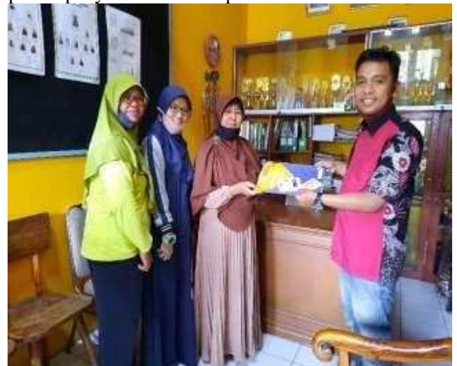
Gambar 8 penyerahan hasil pengabdian

Video dan perangkat pendukung di serahkan langsung kepada kepala sekolah dan ketua yayasan proses penyerahan terlihat pada Gambar 8 di bawah