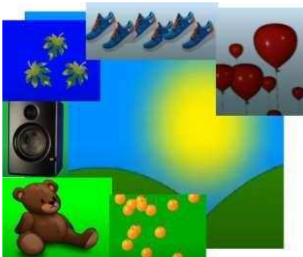
Gambar 6 bahan

Saat ini kegiatan belajar mengajar di Paud Terpadu Allifa di laksanakan secara ansinkron atau di rumah masing masing , di sebabkan karean masa tanggap darurat Covid 19 yang melanda dunia, karena keterbasan tersebut maka distribusi materi juga berubah di mana para guru mengandalkan WA group / atau media online yang lain , bentuk materi digital seperti video lebih mudah untuk di sebarluarskan di group media social, namun karena masih banyak yag menggunakan Hp sebagai media nya maka di buthkan alat untuk menghubungkan media penyimpanan langsung ke hp, maka saya menyerahkan peralatan on the go (OTG ) sebagai sarana pendukung lain , gambar otg terlihat seperti Gambar 7 di bawah. Di karena ukuran video memiliki jumlah yang besar maka materi di simpan dalam media simpan portable yaitu flash, namun