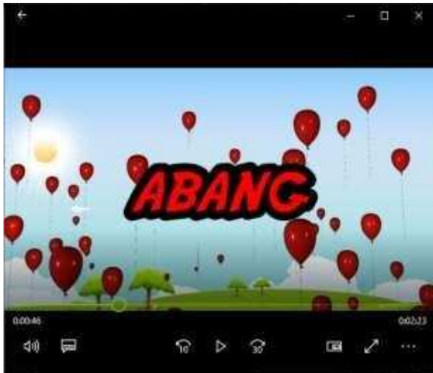
Gambar 5 merah Bahasa jawa