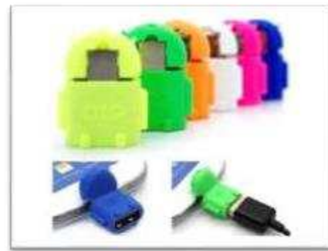
Gambar 7 otg

untuk menyambungkan nnya langsung ke perangkat hp butung perangkat OTG tersebut,