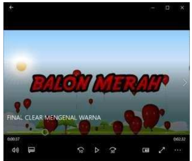
Gambar 3 Tebak warna

setelah itu aka nada tulisan dan narasi dalam 3 bahasa Indonesia dan jawa, scene ini di mulai dari detik ke 37 dst terlihat pada Gambar 3, kemudian di lanjutkan dengan narasi Bahasa inggris nya , scene ini terlihat pada Gambar 4 di bawah, kemudian di lanjutkan pada Bahasa jawa, scene terlihat pada Gambar 5, ada 6 warna yang di kenalkan dalam video ini, merah kuning hijau biru coklat hitam, semua ini di wakili oleh benda benda sekitar kita, kumpulan benda benda tersebut ada pada Gambar 6