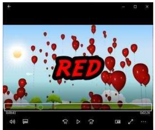
Gambar 4 Merah Bahasa inggris