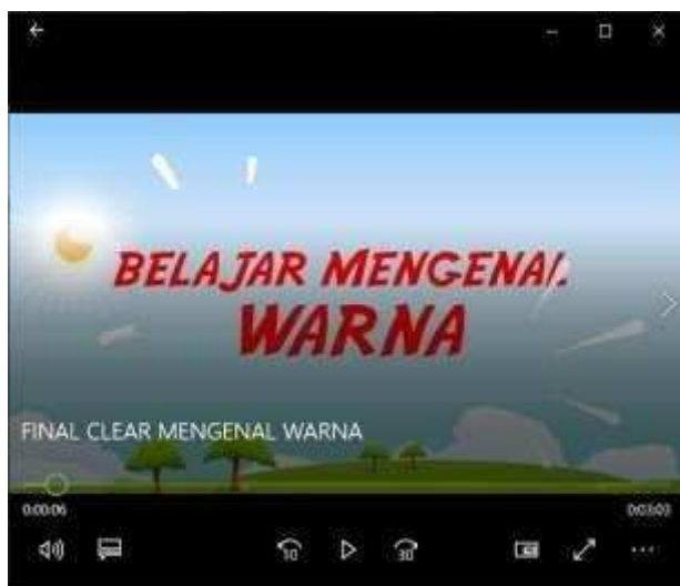
Gambar 2 intro awal

Ada beberapa scene penting dalam video tersebut, yang pertama adalah intro, pendahuluan pengenalan video tersebut, di buka dengan kalimat yang sesuai dengan judul video , hasilnya seperti terlihat pada Gambar 2 dibawah.