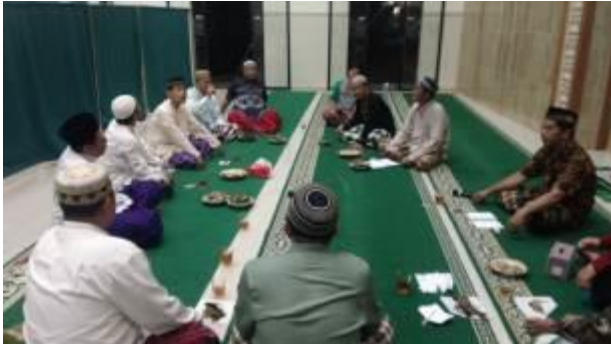
Gambar 5. Pertemuan dan sosialisasi website masjid Citra Ringin Mas

Hasil dari tampilan website ini beserta fitur-fiturnya juga sudah disosialisasikan pada suatu pertemuan yang diselenggarakan oleh pengurus takmir masjid Citra Ringin Mas dan remaja masjidnya sebagaimana ditunjukkan pada gambar 5.