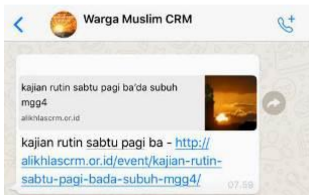
Gambar 6. Informasi kegiatan via Whatsapp yang tertaut ke website alikhlascrm.or.id

Saat ini website sudah tertangani dengan baik dan mampu difungsikan sebagai informasi kegiatan pada Masjid Al-Ikhlas Citra Ringin Mas. Salah satu contoh dari pemanfaatan informasi ini dapat dilihat pada meneruskan informasi melalui grup Whatsapp sehingga meminimalisir penggunaan kertas sebagaimana ditunjukkan pada gambar 6.