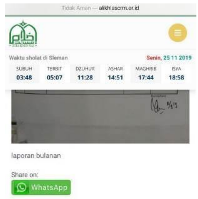
Gambar 4. Fitur meneruskan pesan dari website ke Whatsapp

Dalam suatu kesempatan bahkan sempat dibahas penyampaian informasi agar tidak menggunakan kertas sehingga diharapkan tidak terlalu buang-buang kertas. Salah satu solusi yang saat ini sudah diterapkan adalah penggunaan website yang mempunyai fitur meneruskan pesan ke grup Whatsapp (WA). Fitur ini ditunjukkan pada gambar 4.