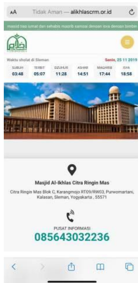
Gambar 2. Tampilan responsive website masjid Al-Ikhlas Citra Ringin Mas

Informasi yang ditambahkan dari hasil implementasi website ini terdiri dari sekilas info, update waktu sholat, agenda, pengumuman jadwal sholat Jum'at, laporan Infaq, Galeri, Video, pengumuman, dan fitur tambahan yang lain. Website ini juga bersifat responsif sehingga diharapkan dapat diakses dalam media smart phone android, tablet, iphone, ipad, dan jenis gadget yang lain. Tampilan website ini ketika diakses di smart phone ditunjukkan pada gambar 2.