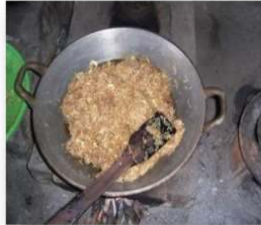
Gambar 4 Proses Memasak Dodol

Dalam sekali proses pembuatan dibutuhkan waktu 3 hari agar dihasilkan 3 Kg dodol dengan jumlah salak yang dibutuhkan ± 15 kg dengan 2 orang pekerja. Jadi setiap petani dalam sebulan dapat menghasilkan ± 30 Kg dodol salak. Adapun proses packaging (pengemasan) dodol salak ditunjukkan pada Gambar 5.