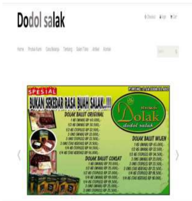
Gambar 7 Tampilan Home

menambah omset penjualan. Dari hasil pengabdian masyarakat ini, menghasilkan sebuah website untuk media promosi dengan domain dodolsalak.com dengan tampilan seperti yang ditunjukkan pada Gambar 7 dan Gambar 8.