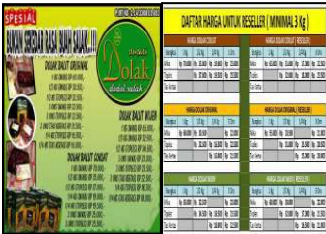
Gambar 6 Leaflet untuk Media Promosi dan Pemasaran

selebaran berupa leaflet. Berikut adalah leaflet dari Ibu Endang Suwarni yang ditunjukkan pada Gambar 6.