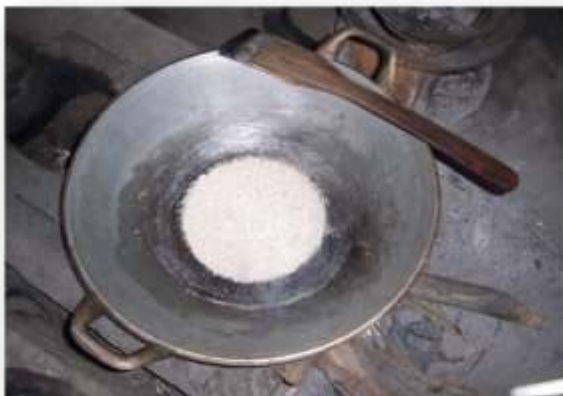
Gambar 3 Proses memasukkan Bumbu Tambahan

Buah salak hasil panen dikupas kulitnya dan kulit arinya menggunakan tangan, setelah itu diparut menggunakan parutan tangan lalu diracik dengan bumbu tambahan. Salak yang sudah diracik dimasak selama ± 45 jam di atas tungku api sambil terus diaduk-aduk sampai matang. Gambar 3 adalah proses memasukkan bumbu tambahan dan Gambar 4 adalah proses memasak dodol salak.