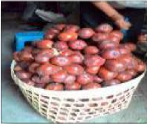
Gambar 2 Hasil Panen Salak Ibu Endang

Pembuatan dodol yang berbahan dasar buah salak diracik dengan bumbu tambahan gula pasir, santan dan sedikit garam. Pengolahan dodol salak ini menggunakan alat-alat yang sederhana mulai dari proses pengupasan kulit, pamarutan salak, proses memasak sampai proses packaging.