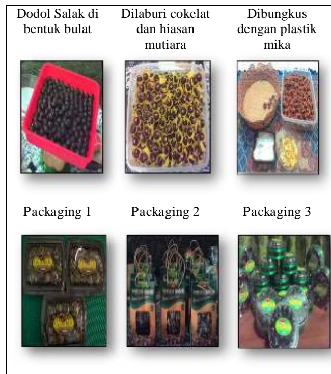
Gambar 5 Proses Packaging Dodol Salak

Dalam sekali proses pembuatan dibutuhkan waktu 3 hari agar dihasilkan 3 Kg dodol dengan jumlah salak yang dibutuhkan ± 15 kg dengan 2 orang pekerja. Jadi setiap petani dalam sebulan dapat menghasilkan ± 30 Kg dodol salak. Adapun proses packaging (pengemasan) dodol salak ditunjukkan pada Gambar 5.