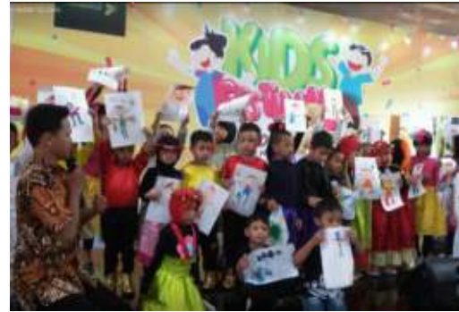
Gambar 7. Hasil Lukis dari Peserta Kids Festival