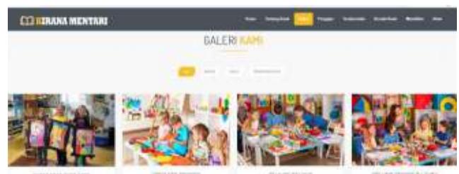
Gambar 14. Tampilan Halaman Galeri

Pada tampilan halaman pendaftaran calon siswa atau orang tua calon siswa bisa langsung mendaftar dengan otomatis terhubung ke no whatsapp pemilik sanggar yaitu bapak Aji Saputro.