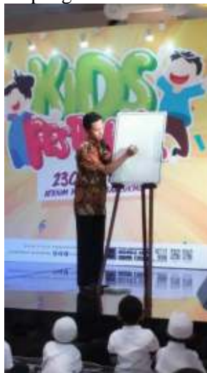
Gambar 5. Demo Melukis

Selain kegiatan rutin mengajar di sekolah atau mitra sanggar Kirana Mentari juga mengikuti demo lukis anak di Ambarukmo Plaza pada acara Kids Festival TK Primagama yang dilaksanakan tanggal 23 Oktober 2018, kegiatan tersebut dapat dilihat pada gambar 5 sampai gambar 7.