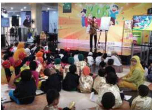
Gambar 6. Demo Melukis dan Berinteraksi dengan Peserta Kids Festival