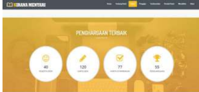
Gambar 12. Tampilan Halaman Penghargaan

Pada tampilan menu tentang kami berisikan tentang profile sanggar lukis Kirana Mentari.