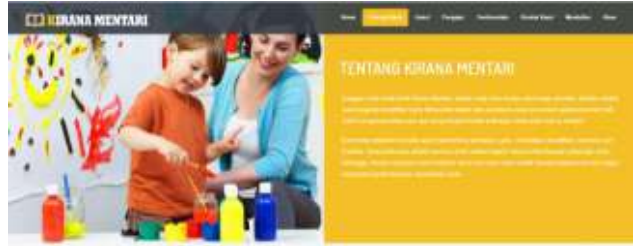
Gambar 11. Tampilan Halaman Tentang Kami

Tampilan website sanggar Kirana Mentari terdapat pada gambar 8 sampai dengan gambar 13. Pada gambar 8 adalah tampilan home dengan 8 menu yaitu home, tentang kami, galeri, pengajar, testimonial, kontak kami, mendaftar dan akun. Pada halaman home ini terdapat gambar dengan 3 slider dan dapat dilihat pada gambar 8 sampai dengan gambar 10.