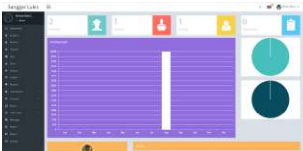
Gambar 15. Tampilan Halaman Akademik

Pada halaman galeri digunakan untuk mengupload gambar-gambar hasil dari belajar mengajar sanggar lukis baik itu yang privat maupun yang datang ke mitra atau sekolah-sekolah.