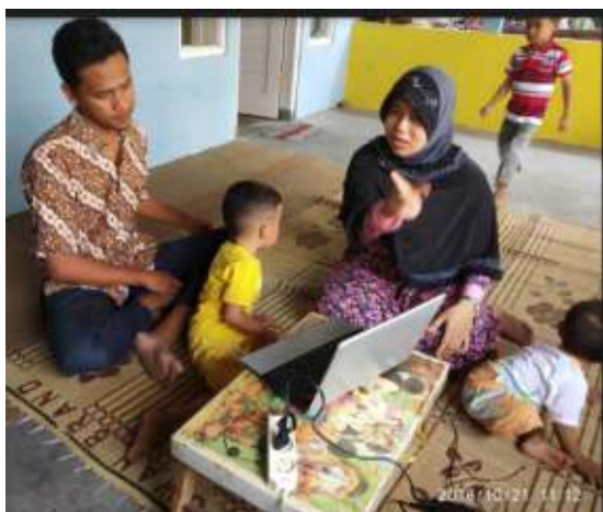
Gambar 17. Kegiatan Pelatihan 1

Pada halaman ini digunakan untuk mengupload, mengedit, menghapus dan menseting halaman muka dari website kiranamentari.com.