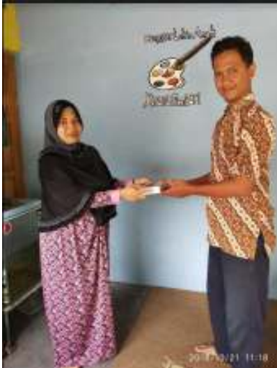
Gambar 20. Penyerahan Modem Internet

Pada gambar 20 adalah penyerahan alat pendukung dari kegiatan Pengabdian Kepada Masyarakat berupa modem internet beserta kartunya untuk mendukung proses upload ke website kiranamentari.com.