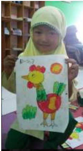
Gambar 4. Hasil Menggambar Siswa Didik dari Mitra TK ABA Jetis

Selain kegiatan rutin mengajar di sekolah atau mitra sanggar Kirana Mentari juga mengikuti demo lukis anak di Ambarukmo Plaza pada acara Kids Festival TK Primagama yang dilaksanakan tanggal 23 Oktober 2018, kegiatan tersebut dapat dilihat pada gambar 5 sampai gambar 7.