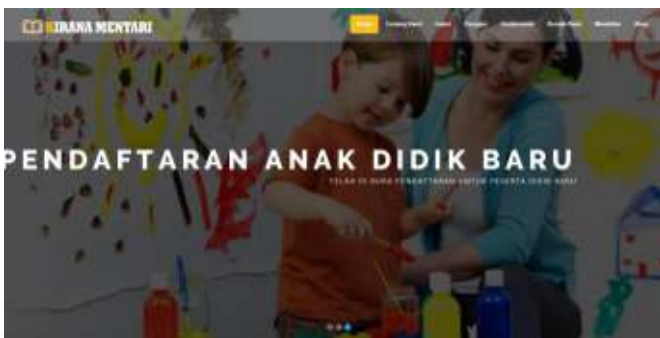
Gambar 9. Tampilan Halaman Home Slider 2