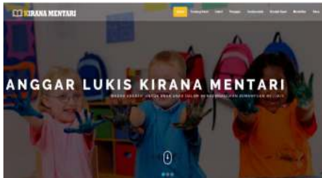
Gambar 8. Tampilan Halaman Home Slider 1

Pada gambar halaman penghargaan digunakan untuk mengupload foto penghargaan bisa yang diperoleh dari sanggar kirana mentari.