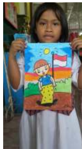
Gambar 3. Hasil Menggambar Siswa Didik dari Mitra TK N 2 Sleman