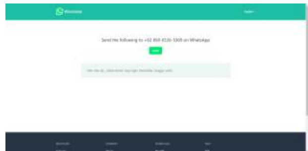
Gambar 13. Tampilan Halaman Pendaftaran

Pada tampilan home gambar slider akan menampilkan foto terbaru yang diupload oleh admin.