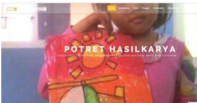
Gambar 10. Tampilan Halaman Home Slider 3

Pada tampilan home gambar slider akan menampilkan foto terbaru yang diupload oleh admin.