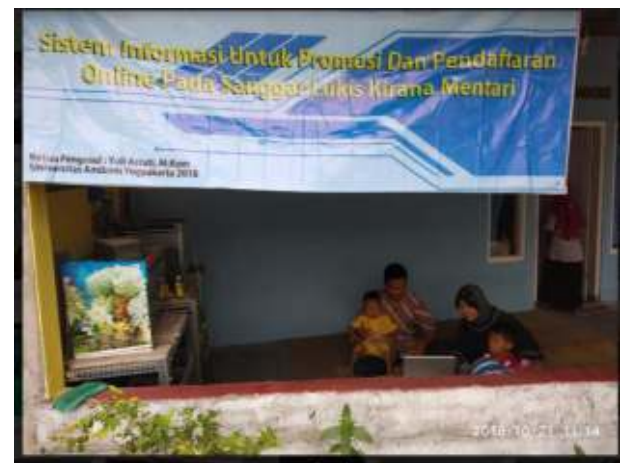
Gambar 19. Kegiatan Pelatihan 3

Pada gambar 18 masih tentang pelatihan penggunaan website sanggar lukis Kirana Mentari.