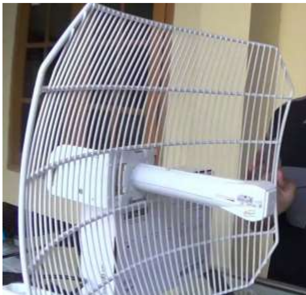
Gambar 3. Ubiquiti AirGrid directional antenna

Antena Secara definisi, antena adalah perangkat konduktif yang digunakan untuk mentransmisikan dan/atau menerima gelombang radio. Perangkat antena dapat berupa perangkat pasif dan sederhana. Namun begitu antena modern yang dibuat untuk tujuan spesial biasanya memiliki desain yang rumit. Beberapa tipe antena didesain untuk menyebarkan sinyal ke semua arah. Ini dikenal dengan omnidirectional antenna; sedangkan antena-antena lainnya dirancang untuk memfokuskan sinyal ke arah tertentu. Antena jenis ini dikenal dengan directional antenna. [4]