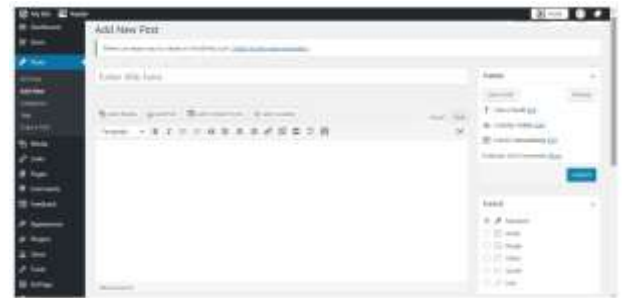
Gambar 2. Membuat Post artikel baru

fakta bahwa post dibagi ke dalam dua kategori dan dapat di-tag dan/atau di-arsipkan. Umumnya, pos merupakan entri blog atau artikel yang akan ditampilkan secara berurutan di website dan dapat disebut sebagai konten yang dipublikasikan berdasarkan waktu. Sementara itu, halaman bersifat statis. Contoh halaman adalah halaman tentang kami atau hubungi kami .