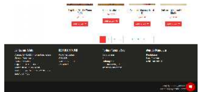
Gambar 6. halaman bawah website

Halaman bawah website ditunjukkan pada gambar 6.