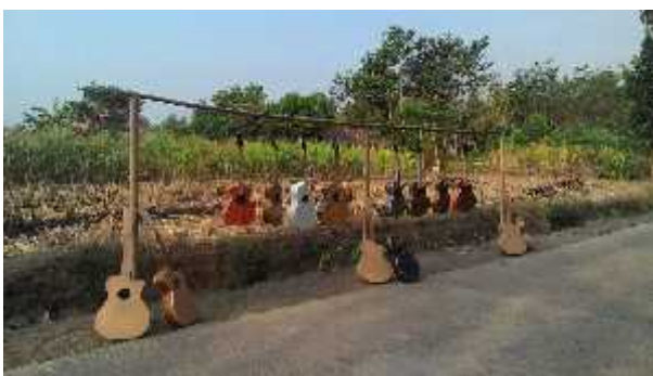
Gambar 2. Produk Rock Guitar instrument

Berdiri sejak tahun 2013, Rock Guitar instrument telah memproduksi ratusan gitar dan telah tersebar di berbagai daerah di Indonesia.