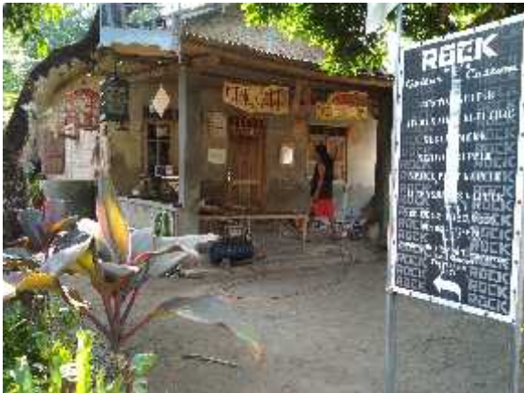
Gambar 1. Rumah produksi Rock Guitar instrument