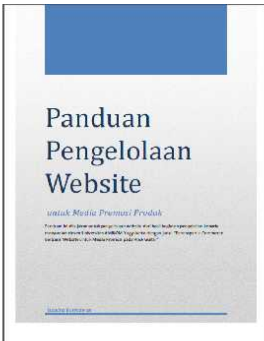
Gambar 8. Halaman sampul panduan

Pada proses penerapan website ini mitra dapat menggunakan panduan dengan judul “Panduan Pengelolaan Website untuk Media Promosi Produk”. Halaman sampul panduan ditunjukkan pada gambar 8.