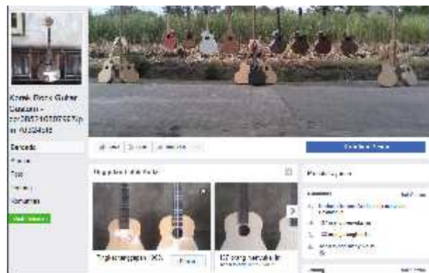
Gambar 3. Halaman facebook mitra

Berdasarkan penjelasan pada analisis situasi menunjukkan bahwa Rock Guitar instrument hanya dikelola oleh 2 orang, seorang sebagai luthier dan seorang sebagai marketing. Luthier bertugas membuat/ melakukan service gitar, sedangkan marketing bertugas mempromosikan produk. Media yang telah digunakan untuk promosi produk meliputi stiker, BBM (BlackBerry Messenger), dan facebook.