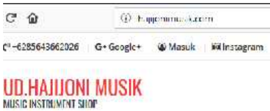
Gambar 7. Alamat website mitra

Pada proses penerapan website ini mitra dapat menggunakan panduan dengan judul “Panduan Pengelolaan Website untuk Media Promosi Produk”. Halaman sampul panduan ditunjukkan pada gambar 8.