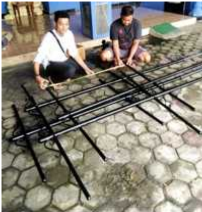
Gambar 3. Tiang besi dari bengkel las

Dari kesepakatan - kesepakatan tersebut, maka kegiatan pengerjaan pembuatan sarana dan prasarana dapat dimulai. Kegiatan dimulai dengan pembuatan sarana media ruang luar (Signage) berupa tiang besi sebanyak empat buah yang dibuat sedemikian rupa dikerjakan di bengkel las (Gambar 3).