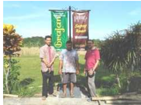
Gambar 5. Media sarana luar setelah terpasang

Akhirnya media sarana luar berupa tiang signage dan banner telah terpasang dengan baik (Gambar 5).