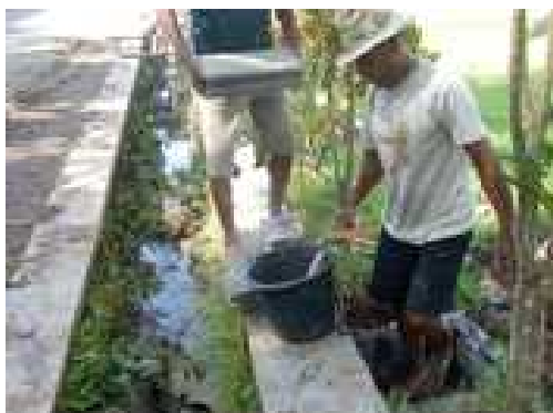
Gambar 4. Pembuatan pondasi dikerjakan oleh warga setempat

Sedangkan untuk Banner sebanyak delapan buah dikerjakan di percetakan. Untuk prasarana Signage yaitu berupa pondasi/ umpak sebagai tempat pemasangan tiang Signage nantinya. Pembuatan pondasi sebanyak empat buah dikerjakan oleh tukang yang merupakan juga warga setempat di Desa Brajan (Gambar 4).