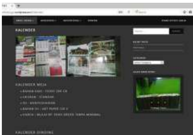
Gambar 10. Halaman Konten Website