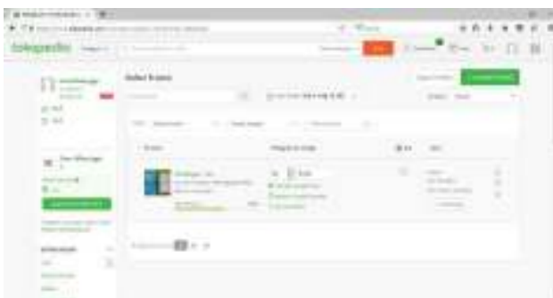
Gambar 14. Akun Tokopedia Percetakan Sinar Offset