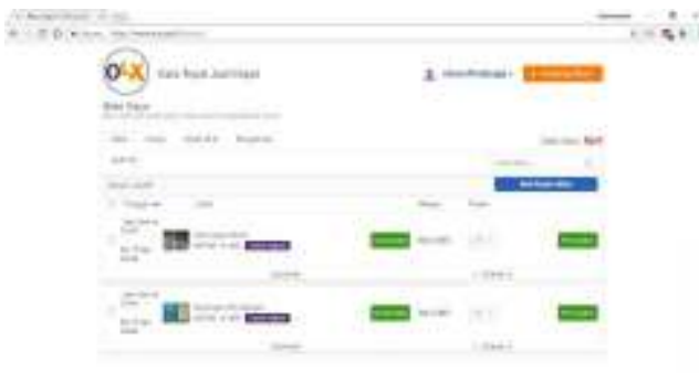
Gambar 13. Akun OLX Percetakan Sinar Offset