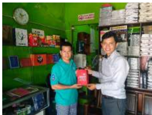
Gambar 3. Proses Penghibahan Modem Huawei 4G kepada Mitra

Kegiatan ini dilakukan untuk meningkatkan kemampuan karyawan mitra dalam menggunakan teknologi informasi khususnya internet. Kegiatan diawali dengan pembelian sebuah model portable merk HUAWEI dan kartu kuota internet (Gambar 3). Kemudian menghibahkan kepada mitra kedua barang tersebut.