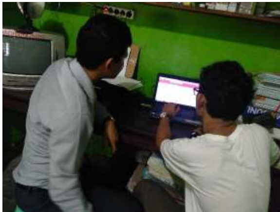
Gambar 4. Pendampingan Pelatihan Optimalisasi Search Engine

diperkenalkan adalah Mozilla Firefox dan Google Chrome fitur-fitur umum internet. Setelah mitra mengenal teknologi tersebut, selanjutnya kativitas yang dilakukan adalah pengenalan mesin pencari atau search engine. Pada aktivitas (Gambar 4) ini pemanfaatan mesin pencari dengan kata-kata kunci tertentu. Pada kasus ini karena tujuan dari pengabdian ini adalah mencari referensi guna memperkaya ide-ide desain yang akan dibuat.