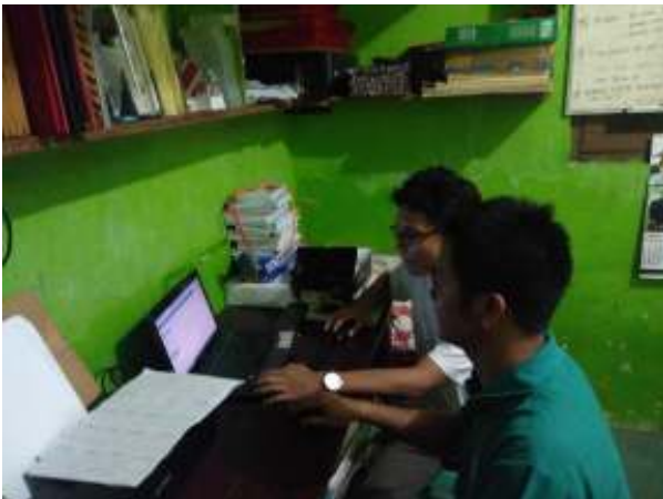
Gambar 8. Pendampingan Pelatihan Manajemen Konten

Kegiatan ini dilakukan sesuai dengan kendala yang dialami mitra khususnya dalam proses menambah kepercayaan pelanggan melalui informasi yang tertera di website. Pada kegiatan ini telah tercipta sebuah website dengan domain gratis yaitu http://sinaroffsetjogja.wordpress.com (Gambar 9). Hasil-hasil dari proses pendampingan manajemen konten dapat dilihat pada Gambar 10.