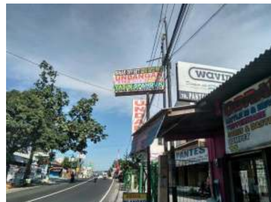
Gambar 1. Pengolahan Bahan Pokok

Percetakan Sinar Offset (Gambar 1) merupakan salah satu percetakan yang bergerak di bidang percetakan, advertising, dan sablon. Produk-produk hasil produksi dari percetakan sinar offset cukup bervariasi. Dari bidang atau divisi percetakan, unit usaha ini menghasilkan beberapa produk seperti undangan, box cathering, buku yasin, brosur, poster, nota, dan lain-lain. Dari divisi advertising, neon box, papan nama, spanduk, ronteks juga merupakan hasil produksinya. Sedangkan di bidang sablon, hasil produksi yang dihasilkan adalah kaos, umbul-umbul, dan bendera. Dengan banyaknya produk yang diproduksi, percetakan ini memiliki potensi untuk berkembang menjadi lebih baik.