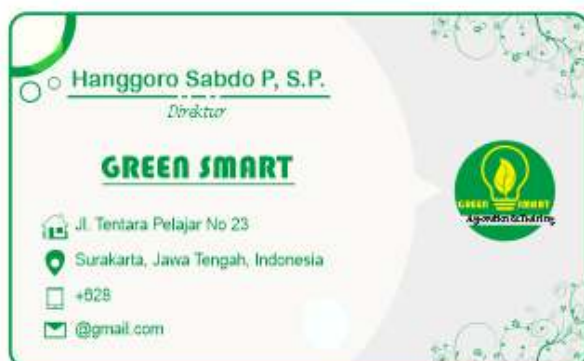
Gambar 6. Contoh Disain yang dihasilkan dari referensi internet

Hasil dari kegiatan pengabdian tahap ini adalah karyawan dari mitra sudah mengenal template-template yang dapat diunduh dan mana template yang berbayar. Pada kegiatan ini juga mitra sudah mengetahui website-website yang menyediakan template-template kartu nama, undangan yang gratis salah satunya adalah situs mockup. Gambar 6 dan 7 adalah hasil modifikasi template yang diunduh oleh karyawan mitra dan sudah dimodifikasi menggunakan alat bantu disain (software) photoshop.