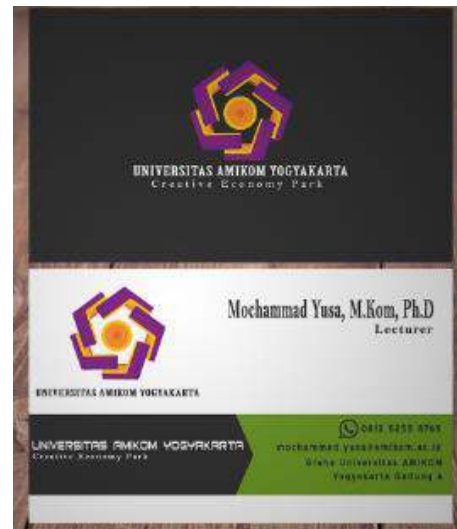
Gambar 7. Contoh Disain yang dihasilkan dari referensi internet

Kegiatan pengenalan internet yang dilakukan tidak banyak mengalami kesulitan karena karyawan baru yang direkrut oleh owner sudah menjadi karyawan dipercetakan sinar offset selama tiga bulan. Sehingga walaupun karyawan tersebut tidak terlalu mengetahui terkait teknologi internet namun karyawan tersebut cukup familiar dengan sistem operasi windows dan bagaimana menggunakan internet browser dan mengkoneksikan dengan modem.