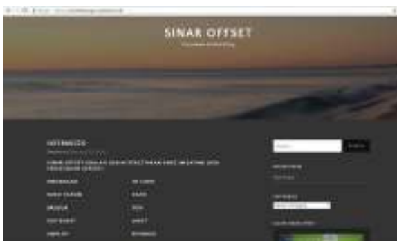
Gambar 9. Halaman Utama Website

Kegiatan ini dilakukan sesuai dengan kendala yang dialami mitra khususnya dalam proses menambah kepercayaan pelanggan melalui informasi yang tertera di website. Pada kegiatan ini telah tercipta sebuah website dengan domain gratis yaitu http://sinaroffsetjogja.wordpress.com (Gambar 9). Hasil-hasil dari proses pendampingan manajemen konten dapat dilihat pada Gambar 10.