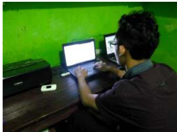
Gambar 11. Pelatihan dan Pendampingan pengelolaan akun-akun Toko Online

Kegiatan pengabdian untuk masalah ini dilakukan selama dua kali pertemuan. Pertemuan pertama adalah pendampingan pembuatan akun-akun pada Toko-toko online tersebut. Kegiatan pertemuan kedua (Gambar 11) adalah kegiatan pendampingan manajemen toko online yang sudah dibuat. Kegiatan ini cukup lancar dan hampir tidak ada kendala. Namun ada sedikit kendala yaitu ketidakfamiliaran dan tata letak setiap halaman aplikasi web toko online yang cenderung berbeda.