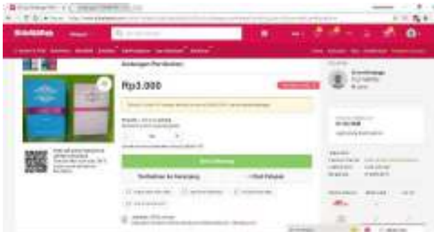
Gambar 12. Akun Bukalapak Percetakan Sinar Offset