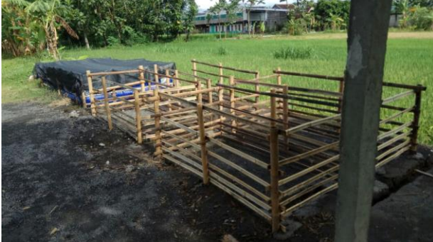
Gambar 1. Lahan yang digunakan oleh mitra

Mitra telah menyiapkan lahan seluas \pm 900 \times 500 meter untuk proses pembibitan ikan lele.