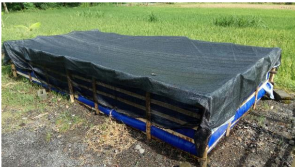
Gambar 2. Kolam untuk proses pendederan

Jumlah kolam untuk saat ini berjumlah 6 buah, yang meliputi kolam indukan, penetasan, pendederan, dan pemijahan.