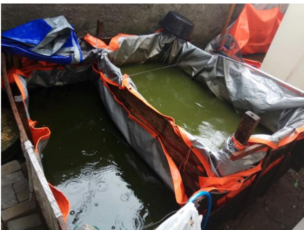
Gambar 3. Kolam untuk indukan atau pemijahan

Kolam untuk indukan berjumlah 2 kolam dengan ukuran 1 \times 2 meter. Kolam untuk proses penetasan berjumlah 1 kolam dengan ukuran 2 \times 4 meter.