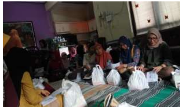
Gambar 5. Penjelasan Materi mengenai Peluang Usaha

Ketika seseorang menghadapi pensiun maka ada beberapa macam kesibukan yang dilakukan oleh para pensiunan, diantaranya dapat menjadi investor, pekerja mandiri atau pemilik sebuah usaha. Investor dalam hal ini dapat berupa menerima profit sharing yang diberikan oleh pelaku usaha, membeli saham atau membeli dan menjual valuta asing. Seorang pensiunan yang berkeinginan menjadi pemilik suatu usaha dapat membuka bisnis secara kecil-kecilan untuk menambah pemasukan selama menjalani masa pensiunnya. Suatu usaha atau bisnis yang dimiliki para pensiunan memiliki beberapa kelebihan, diantaranya: melatih otak agar tidak mudah pikun, menambah pemasukan untuk masa pensiun yang lebih sejahtera, dan untuk mengisi waktu luang agar tubuh dan pikiran menjadi tetap sehat.