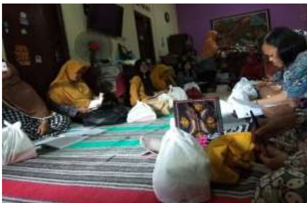
Gambar 6. Penjelasan Materi mengenai Perencanaan Investasi Keuangan

Disamping penjelasan materi mengenai peluang usaha dijelaskan pula materi tentang perencanaan investasi keuangan pentingnya perencanaan keuangan setelah masa pensiun tiba, persiapan masa pensiun, pentingnya investasi untuk menghadapi masa pensiun, dan jenis-jenis investasi untuk persiapan masa pensiun.