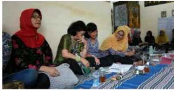
Gambar 2. Kegiatan Arisan dan Simpan Pinjam

Kegiatan pertemuan rutin meliputi arisan dan simpan pinjam dilaksanakan setiap tanggal 10 disetiap bulannya. Kegiatan pertemuan rutin tersebut bertempat di rumah para anggota PKK secara bergantian.