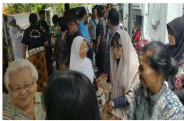
Gambar 4. Kegiatan Gotong Royong Membantu Warga

Sebagai bentuk perwujudan rasa gotong royong antar sesama warga, maka adapula kegiatan sosial seperti menengok anggota dan keluarga inti anggota yang sakit baik di rumah ataupun di rumah sakit dan mengikuti takziah ke rumah keluarga anggota yang terkena musibah dan meninggal dunia. Kegiatan lainnya adalah acara memasak bersama jika ada warga yang memiliki hajatan seperti acara pernikahan, khitanan, ataupun ketika ada acara seperti malam tirakatan, syawalan, dan sebagainya.