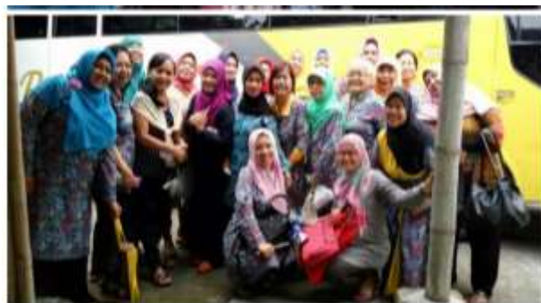
Gambar 3. Kegiatan Piknik Bersama

Di samping kegiatan pertemuan rutin seperti arisan dan simpan pinjam, adapula kegiatan lain seperti posyandu yang dilaksanakan setiap tanggal 7 di tiap bulannya, kegiatan syawalan dan piknik bersama setiap satu tahun sekali, dan pengajian yang dilaksanakan setiap hari Kamis Wage.