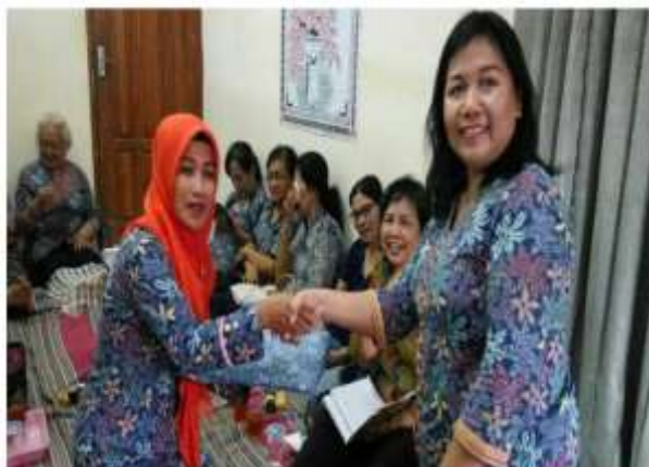
Gambar 1. Pelantikan Kepengurusan Kelompok PKK RT 44 Tuntungan Periode 2014 – 2018

Susunan pengurus ini sudah berakhir masa periodenya sejak terpilihnya Ketua RT 44 terbaru pada tanggal 16 Maret 2018. Saat ini sedang dilakukan proses pemilihan susunan pengurus kelompok PKK RT 44 Tuntungan untuk memilih pengurus baru periode 2018 – 2022.