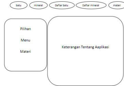
Gambar 3. Halaman Utama

Rancangan antarmuka sangat diperlukan untuk mempermudah user menggunakan aplikasi ini. Rancangan antarmuka aplikasi ini meliputi