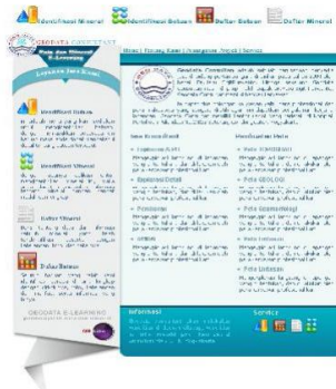
Gambar 4. Halaman Utama

Halaman home adalah halaman ketika egeodata.com dibuka halaman ini menampilkan selamat datang, dan sekilas tentang Geodata Consultant