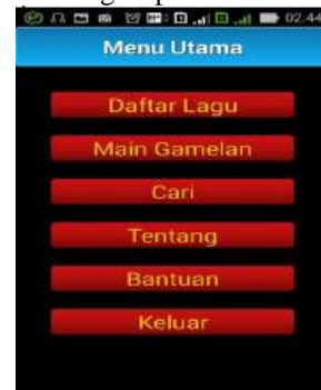
Gambar 1. Halaman menu utama

Menu awal adalah tampilan pertama setelah splash screen. Terdapat 6 tombol yang masing-masing berbeda fungsi apabila ditekan.