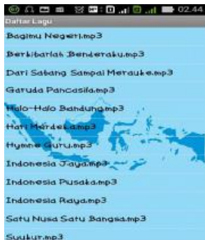
Gambar 3. Halaman best jumping frog

Halaman ini merupakan tampilan listview yang di gunakan untuk menampilkan semua nama lagu berdasarkan kategori dipilih yang sudah di inputkan pada database dimana user dapat memilih salah satu nama lagu. Jika salah satu listview nama lagu ditekan maka akan menuju pada halaman putar lagu dan lirik