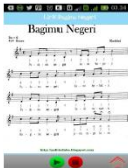
Gambar 4. Halaman Putar Lagu

Halaman play lagu merupakan form dimana pengguna dapat melihat lirik dan notasi, memutar lagu dengan menekan tombol play, menghentikan sementara dengan menekan tombol pause yang berganti dengan tombol play, menghentikan lagu dengan menekan tombol stop dan melihat deskripsi lagu berupa sejarah atau makna dari lagu yang dipilih dengan menekan tombol info.