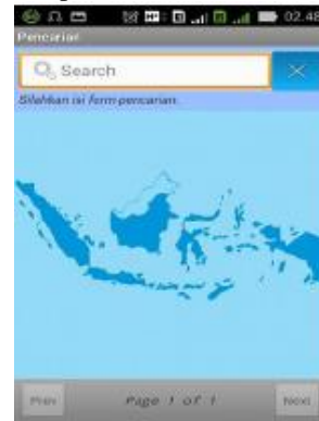
Gambar 5. Halaman Pencarian

Form pencarian merupakan form yang digunakan untuk melakukan pencarian nama lagu yang ada pada aplikasi.