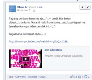
Gambar 10. implementasi di www.facebook.com