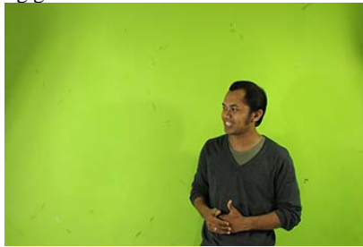
Gambar 8. Proses Syuting

Tahapan ini merupakan tahapan dimana proses syuting berlangsung, adegan disesuaikan dan dilakukan berdasarkan rencana dari skenario dan storyboard yang telah dibuat. Dibawah merupakan proses dimana pengajar berakting dengan latar belakang green screen.