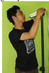
Gambar 4. Tiang penopang Lampu