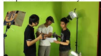
Gambar 6. Pembahasan storyboard.

Pembahasan storyboard untuk menggambarkan gerakan atau acting yang harus di lakukan oleh pengajar saat proses syuting berlangsung hal ini dilakukan agar terjadi keselarasan antara gerakan dengan proses pembuatan animasinya.