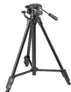
Gambar 2. Tripod untuk Kamera