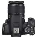
Gambar 1. Kamera DSLR 650D