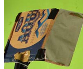
Gambar 5. Reflector sederhana.