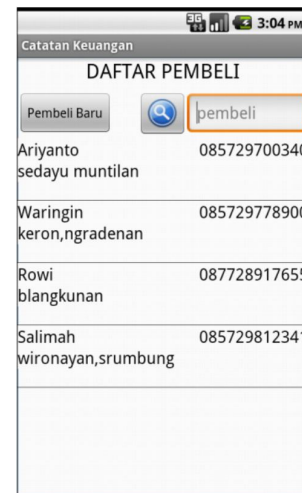
Gambar 3 Halaman Daftar Pembeli