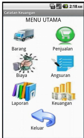
Gambar 1 Menu Utama

Dalam aplikasi ini pembuatan database dilakukan di luar eclipse yaitu dengan menggunakan perangkat lunak SQLite. Untuk memulai membuat database, mulailah dengan menjalankan SQLite.