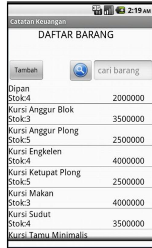
Gambar 2 Halaman Barang