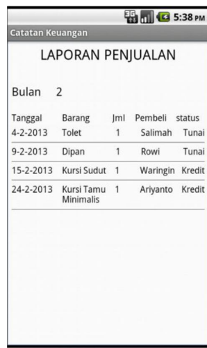
Gambar 6 Halaman Laporan