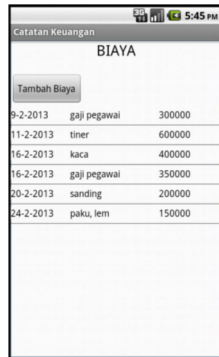
Gambar 4 Halaman Biaya