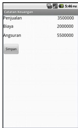
Gambar 7 Halaman Keuangan